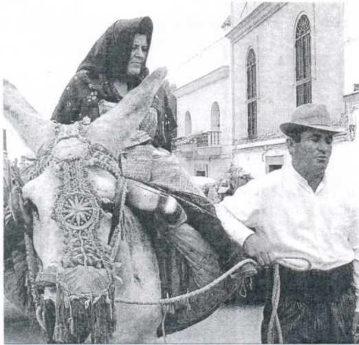
La participación en anteriores ediciones ha sido numerosa.

El regreso de esta "genuina marcha festiva y social" terminará en