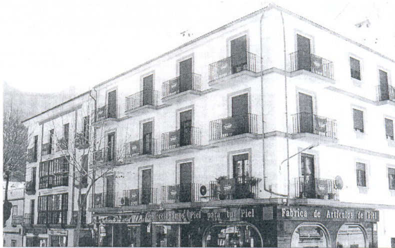
Imagen de las pancartas en balcones de Ubrique.

El reparto de abanicos y viseras incluso podría ampliarse también a las ferias de Arcos y Villamartin, si bien dependerá de la empresa patrocinadora. Se pretende así aprovechar la afluencia de turistas y medios de comunicación a estos eventos para dar a conocer sus de-