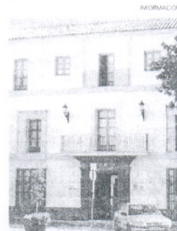
Oficina de Fomento.

La delegada de Fomento resaltó que los demandantes de empleo que se acercan a la Oficina para informarse o inscribirse en cursos, o realizar alguna gestión, y necesiten actualizar su demanda de empleo, lo podrán hacer di-