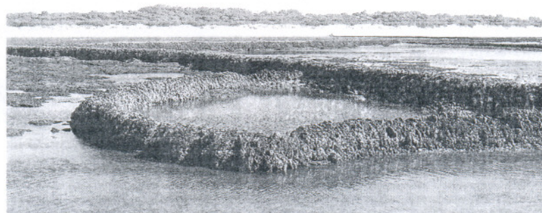
Corrales de Rota.