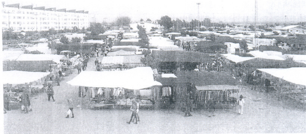
SEUEÑO. Los mercadillos son un auténtico estallido de luz y de color, como el isleño, en que la algarabía forma parte de sus atractivos.