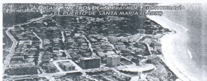
A ESCASOS METROS DE LA PLAYA DE FUENTE BRAVIA - EL PUERTO DE SANTA MARÍA (CÁDIZ)

Ferrer gana el torneo de tenis de Tokio y Robredo se impone en el de Metz. 25