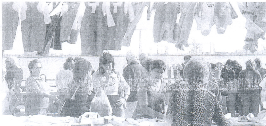
MARCO INCOMPARABLE. El 'Piojito' se trasladó provisionalmente a la avenida de la Bahía a finales del año pasado.

El Piojito de Barbate se instala todos los jueves por la mañana en las explanadas de El Zapal.