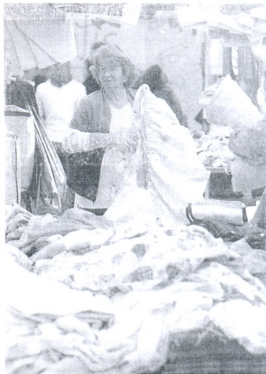
Las mujeres son las más asiduas pero también hay hombres.

En Chiclana, la denominación del mercadillo se simplifica al día en el que se celebra: Los Martes. Tras haber pasado por diferentes lugares, como la calle Paciano del Barco o La Longuera, su ubicación actual es el Parque Periurbano de Las Albinas. No obstante, hasta el día 13 de noviembre estará en el antiguo recinto ferial de La Longuera, ya que en Las Albinas están situadas las carpas de Volkswagen. Los Martes cuenta con 169 puestos de moda, zapatos, complementos, ropas de hogar y flores, además de varios módulos para la venta de bocadillos y frutos secos; la mayoría de ellos posee un espacio de seis metros. El horario de apertura es de 9.00 a 14.00 horas. Tanto en su ubicación ocasional, como en la permanente, el aparcamiento no supone ningún problema, ya que al ser recintos feriales, cuentan con suficiente espacio. El mercadillo de Chiclana tiene bastante aceptación entre los chicaneros, así como por los vecinos de las localidades de La Janda. Además, una empresa turística oferta una excursión a los visitantes del Novo Sancti Petri para que hagan el shopping genuino de la zona.