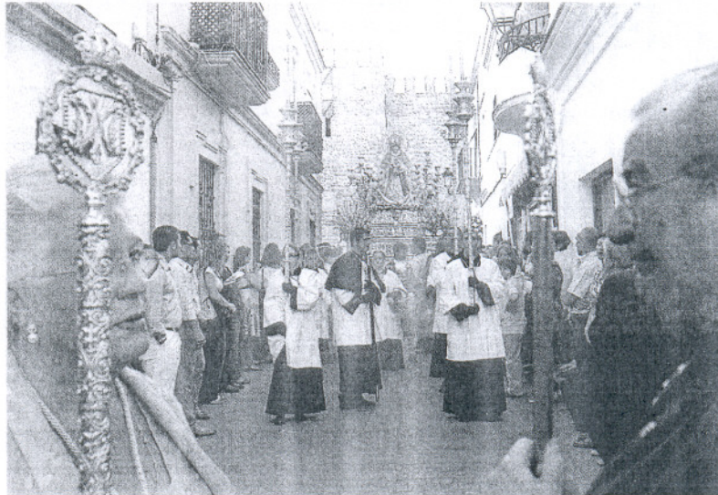
La Patrona de Rota volvió a reencontrarse en la tarde de ayer con su pueblo.

Mezclado con el ambiente popular, los actos lúdicos y religiosos se han sucedido siendo centro de todos ellos las damas del Rosario, 25 chicas que representan el papel de la mujer roteña y que acompañan a la Virgen en cada uno de ellos.