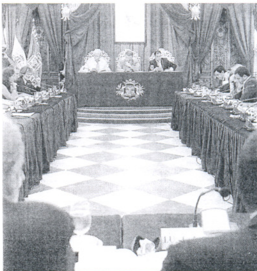
Imagen de un pleno anterior de la Diputación Provincial.

El PP pidió un impulso al turismo de salud en su versión de talasoterapia como alternativa a la estacionalidad del sector.