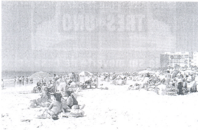
LIMPIAS. Los usuarios de las playas de Rota valoran el estado de la arena y de las aguas.

Los aspectos mejor valorados de las playas roteñas, según este informe, son la limpieza tanto de la arena como de las aguas y los servicios de salvamento, mientras que los servicios e instala-