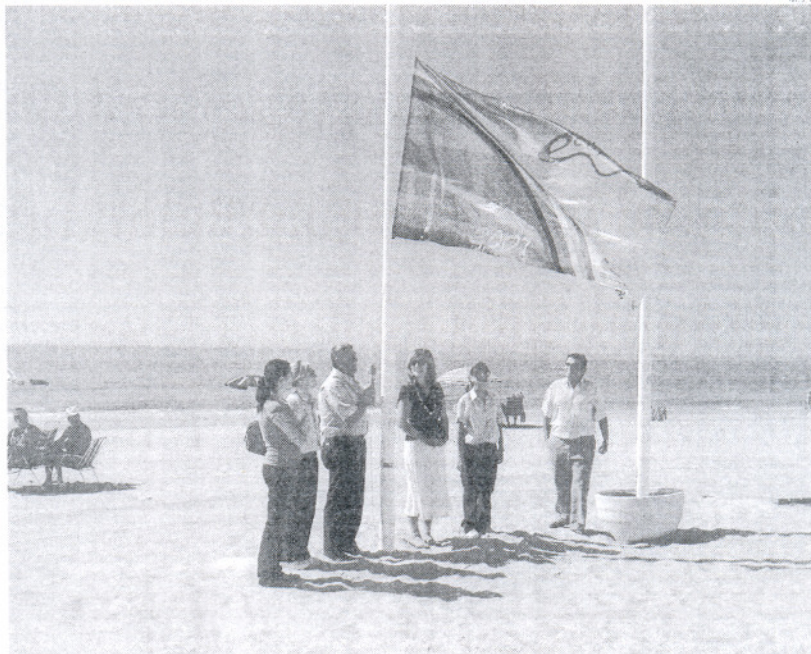
El delegado de Playas y Medio Ambiente iza la bandera 'Ecomar 2007' con parte de su equipo.

De las veinte banderas concedidas por todo el territorio nacional, tres se quedan en Andalucía, y una de ellas en el municipio. Huelva y El Puerto de Santa