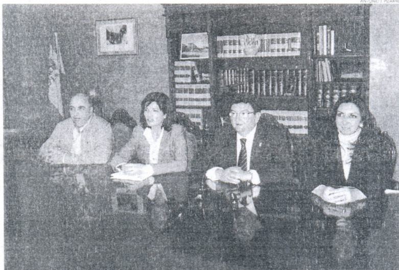
Rueda de prensa posterior al encuentro entre el alcalde y la parlamentaria andalucista.

Cuatro son los temas más destacados y que los andalucistas intentarán que se recojan en el presupuesto autonómico. En primer lugar se destacó la importancia que para Rota tendría la puesta en marcha de un Plan de Saneamiento Integral, necesario para eliminar los aliviaderos de aguas pluviales de la playa, "algo muy importante para desarrollar el