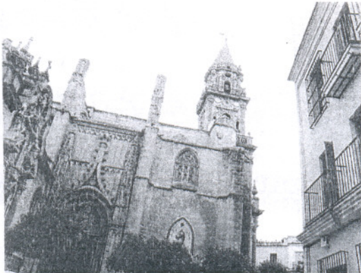
SAN MIGUEL. Los cofrades visitaron la parroquia.