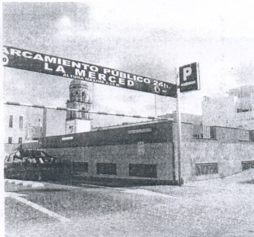
El aparcamiento ya cuenta con 102 plazas para automóviles.

Para solicitar el nuevo pase ante la Oficina de Atención al Ciudadano será necesario cumplir los mismos requisitos que en el abo-