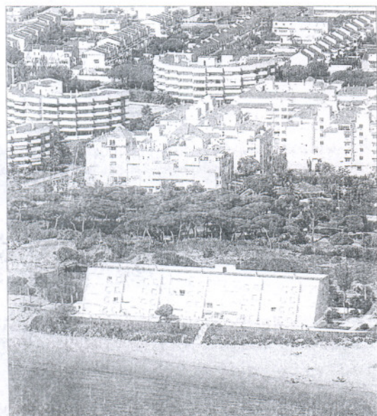
Edificios en la playa de El Portil.