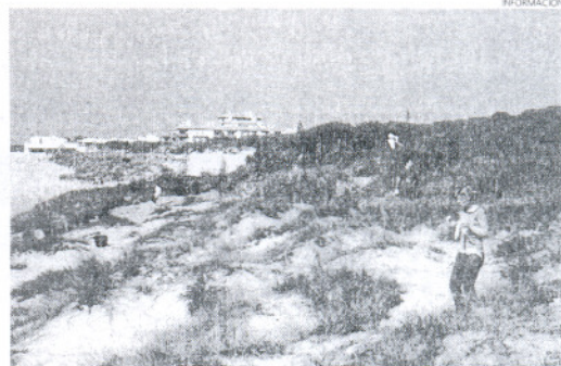
Recogiendo basura y observando la vegetación de las dunas.

La siguiente actividad será el día 17, una campaña sobre la gestión de los residuos urbanos que