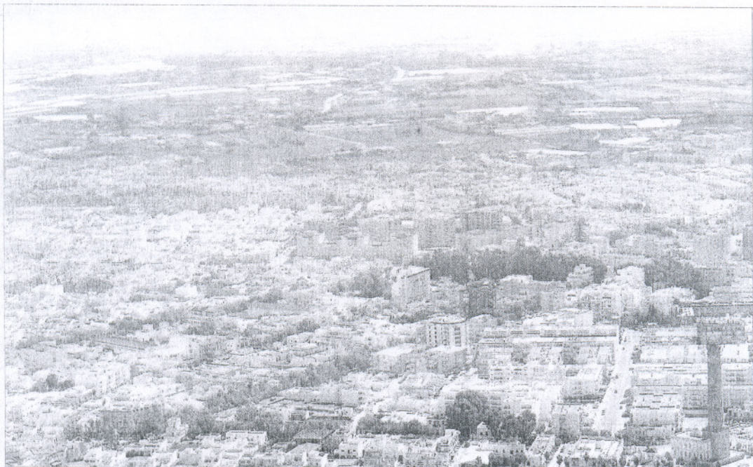
Vista aérea de la localidad gaditana de Chipiona.