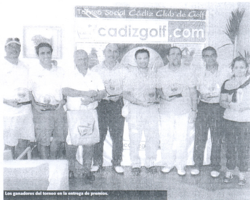
Los ganadores del torneo en la entrega de premios.