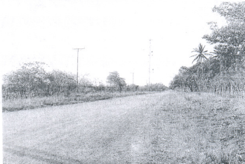
El Ayuntamiento quiere hacer un estudio cartográfico para delimitar físicamente los caminos/ LA VOZ

Al margen de esta iniciativa, en el transcurso de esta reunión se abordaron aspectos relacionados con la instalación de antenas para móvil. Con relación a este asunto, Ecologistas en Acción quiso compartir su preocupación por