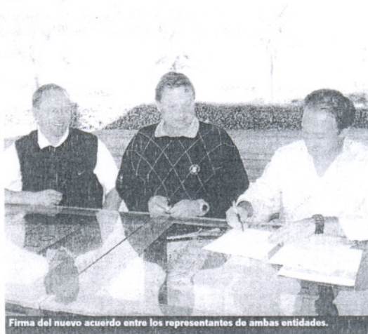
Firma del nuevo acuerdo entre los representantes de ambas entidades.

Desde ambas partes se coincide en la idea de que acuerdos de esta índole que tienen como fin facilitar los recursos y el entorno óptimo de entrenamiento para los equipos nacionales finlandeses y de otras nacionalidades suponen un gran refuerzo en el desarrollo