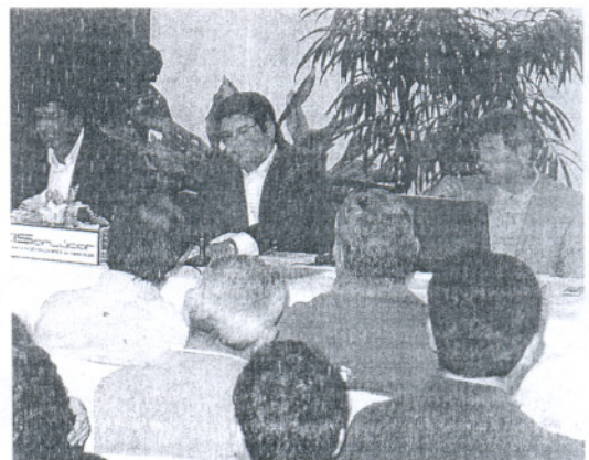
Los delegados abrieron el debate y contestaron a las preguntas