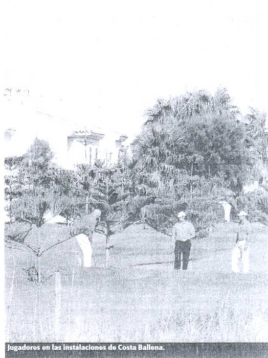
Jugadores en las instalaciones de Costa Ballena.