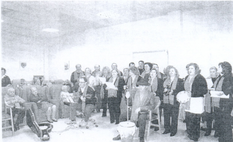
VILLANCICOS. El coro de la asociación de San Lucas hizo las delicias de los mayores.

Asimismo, Alhambra aprovechó oportunidad para agradecer «el esfuerzo y la colaboración que viene realizando el personal de la residencia de ancianos, que han sabido adaptarse a las nuevas exigencias planteadas por la dirección con motivo del ingreso de 15 abuelos más en la misma». «Este aumento de residentes ha supuesto una carga de trabajo que ha obligado a una