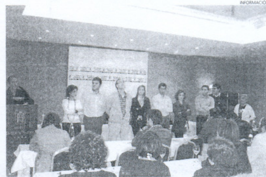
Imagen del nuevo comité de Roteños Unidos.

En este sentido, quiso reseñar que Roteños Unidos es un partido del pueblo y para el pueblo con una clara vocación de servicio a