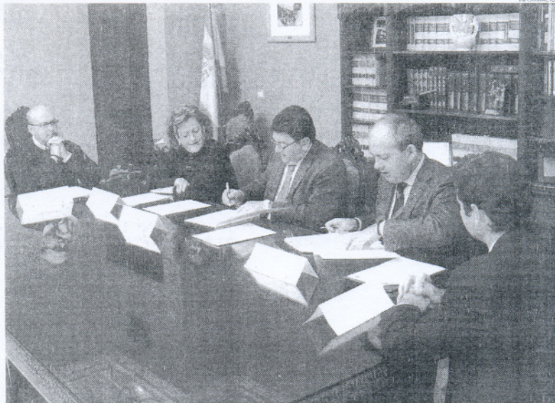
El convenio se firmó en la Sala de Juntas del Palacio Municipal Castillo de Luna.

La firma del convenio con la Fundación Bahía de Cádiz para el Desarrollo Económico (CEEI