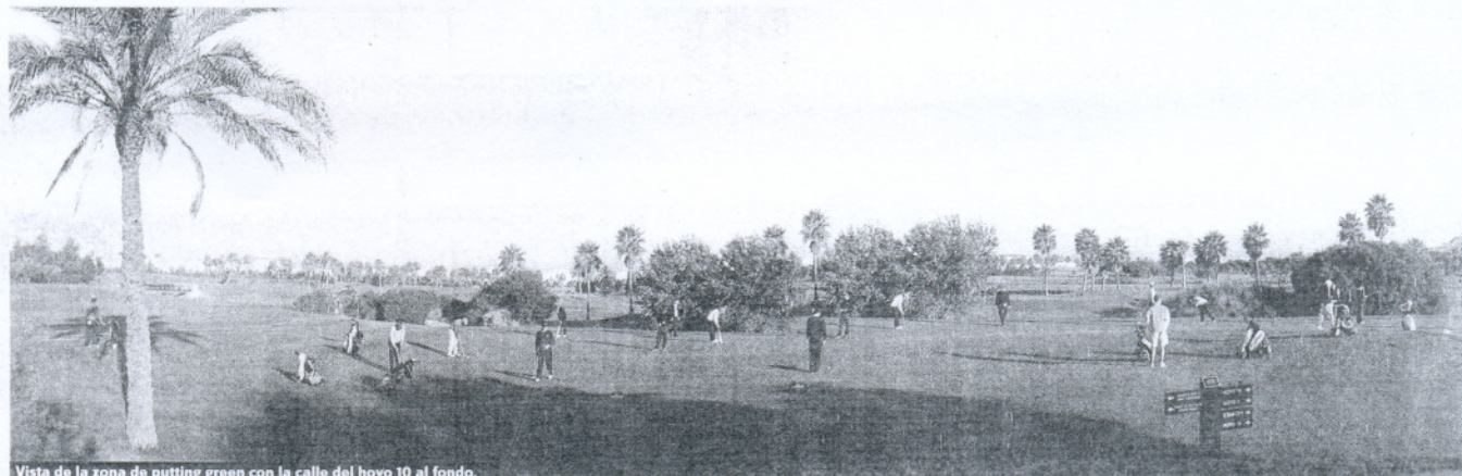
Vista de la zona de putting green con la calle del hoyo 10 al fondo.