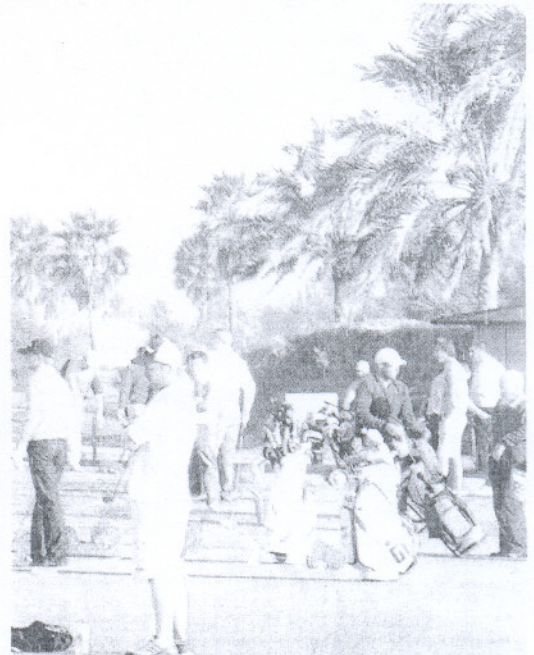
¡Lleno fue total en las instalaciones del club de golf de Costa Ballena.

quedó roto el maleficio de las lluvias que en ediciones anteriores acompañara a esta celebración.