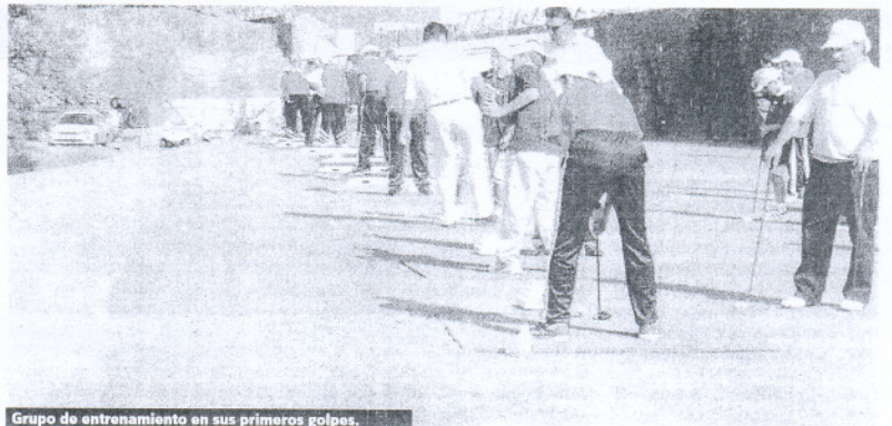
Grupo de entrenamiento en sus primeros golpes.

Durante las otras dos jornadas, los alumnos discapacitados (físicos, orgánicos, psíquicos y sensoriales) recibieron clases impartidas por los profesionales, bajo la supervisión de los formadores. En total se contó con 30 participantes de AFANAS (asociación gaditana para discapacitados psíquicos), Club Arco Iris (alumnos parapléjicos, con poliomeilitis y doble amputación), APESORJE (discapacitados auditivos) y discípulos que habitualmente asisten a las clases de golf adaptado que ya se imparten en La Cañada.