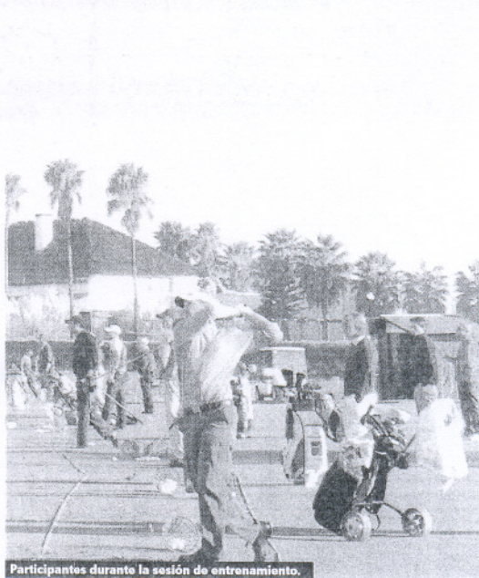
Participantes durante la sesión de entrenamiento.