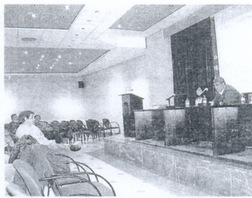
El delegado de Medio Ambiente explicó los principales proyectos.

ciaciones de la localidad relacionadas con temas medioambientales que conforman el Consejo Sectorial, pudieron conocer estos proyectos, así como el punto en el que se encuentran cada uno de ellos, a través de la presentación ofrecida por la Fundación de Medio Ambiente de la Fundación Municipal de Agricultura y Medio Ambiente, que estuvo acompañada por el vicepresidente de dicha Fundación y delegado de Medio Ambiente, Anto-