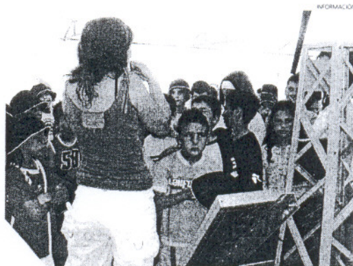
El Día Mundial del Medio Ambiente se celebró en la plaza de La Merced.

También con motivo de la celebración de este día internacional cabe reseñar que el Jardín Botánico Celestino Mutis acogerá los próximos días 9 y 10 de junio