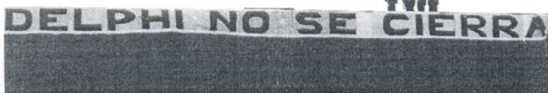
Los activos de la planta de Delphi serán cedidos por la empresa a la Junta o a quien ésta designe.

Por otra parte, la Federación Minerometalúrgica de CCOO ha pedido al Gobierno central y a la Junta de Andalucía que "hagan