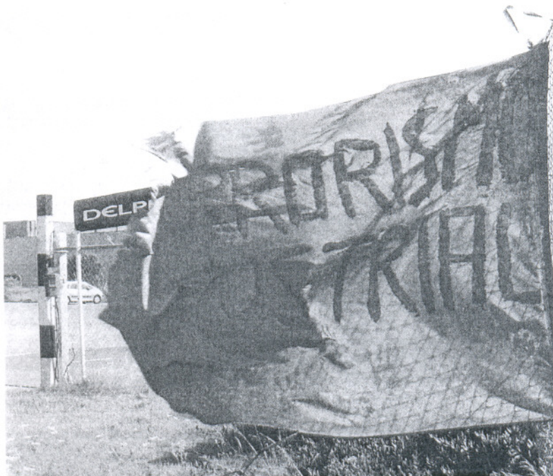
La factoría de Delphi en Puerto Real, completamente desierta en la mañana de ayer.