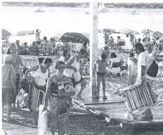
Bañistas saliendo de una playa de Sanlúcar. ANDREA

■ SANLÚCAR. La Junta de Andalucía, la Mancomunidad del Municipios del Bajo Guadalquivir y los ayuntamientos de Sanlúcar, Rota y Chipiona invertirán más de dos millones de euros en el equipamiento y demás actuaciones encaminadas a "fomentar uso y mejora de los servicios de las playas de la comarca" en esta temporada oficial de baño.