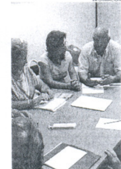
Imagen del encuentro.