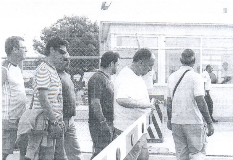
Trabajadores saliendo ayer de la planta clausurada de Puerto Real.

Las previsiones que maneja la Junta son que el próximo viernes comiencen a registrarse en el SAE los empleados cuyos apellidos es-