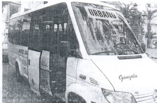
Uno de los autobuses urbanos que se encuentran en periodo de pruebas.

Los horarios, en un principio, serán desde las diez de la mañana hasta las dos de la tarde y se reanudará el servicio de cinco a ocho de la tarde.