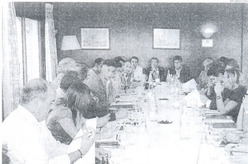
Los ayuntamientos gobernados por el PP abandonaron el jueves la reunión del Foro Municipal Costero.

El dirigente popular consideró que el Foro "no tiene ninguna base legal y pretende asumir unas competencias que no pertenecen