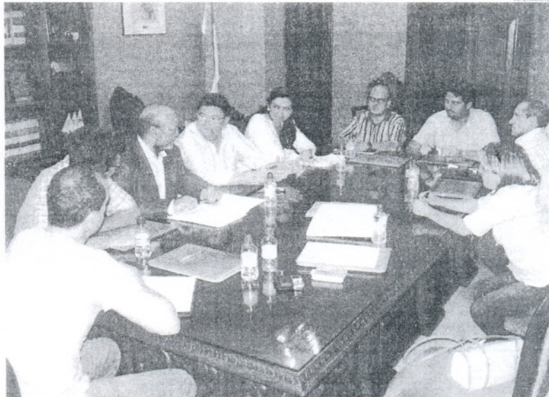
Ignacio García conoció de primera mano el estado de la solicitud del Ayuntamiento a la Junta de Andalucía.

Los miembros del equipo de Gobierno expusieron con detalle ante el parlamentario andaluz las gestiones realizadas para conseguir la construcción del centro sanitario, así como las dificultades encontradas con la Administración Sanitaria Andaluza, haciéndole entrega de un dossier con la documentación correspondiente. El parlamentario andaluz de Izquierda Unida se mostró muy