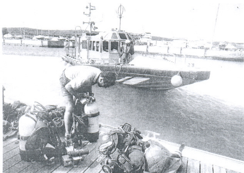
RESCATE. Buzos de la Guardia Civil durante las labores de rescate del pasado septiembre.

Especial del 'Nuevo Pepita Aurora' con galería de fotos y vídeo. lavozdigital.es