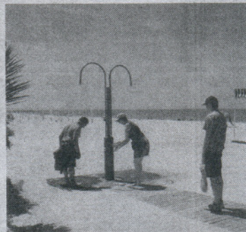
Las duchas y lavapiés seguirán prestando servicio.

avances que el litoral roteño ha venido experimentando son en materia de asistencia a los discapacitados. Las playas ponen a disposición de las personas con movilidad reducida el anfiteatro, que hasta ahora está en el Chorrillo-Rompidillo, la Costilla, Punta Candor o Costa Ballena, así como el Novaf, que estará operativo todos los días de 12.00 a 18.00 horas.