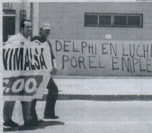
Los empleados anuncian que continuarán las movilizaciones.

El domingo se hicieron efectivos los siete despidos anunciados por la empresa, pero "se han añadido" dos más, sin contar "todos los eventuales que no han sido renovados", según el representante de CCOO. Además, dos de los despedidos "eran fijos" y a otros dos "les han negado el desempleo, por lo que están piteando".