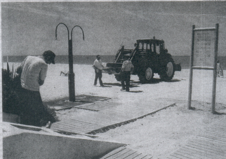
Operarios municipales trabajaban durante estos días contrarreloj para tener todo a punto.

Entre las novedades también se encuentra la ampliación del horario de atención al público en la Costilla y Rompidillo Chorrillo desde las ocho de la mañana a las nueve de la noche.