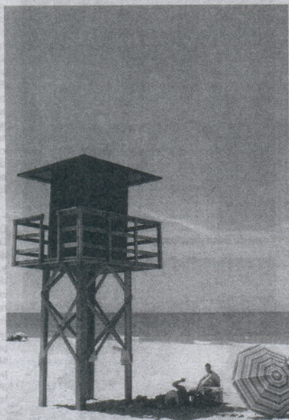
En las playas hay instaladas catorce torretas.

Destacar además el balizamiento de los espigones que se ha realizado de cara a esta temporada. Con esta medida se reserva un espacio de seguridad alrededor de estas estructuras evitando así cualquier peligro para los bañistas, al mismo tiempo que se da la posibilidad a los amantes de la pesca, de practicar en esta zona en