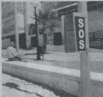
Nuevos sistemas de megafonía con postes de SOS.