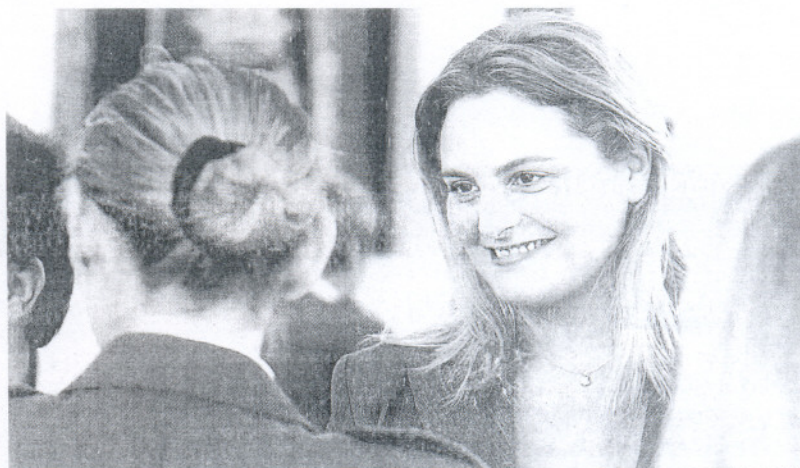
La juez Olga Cecilia Simón, en el acto de entrega de la distinción por parte de la Guardia Civil el pasado 12 de octubre.

Derechos Humanos denuncia la "indefensión" de unos 30 jóvenes de Conil en prisión preventiva desde hace meses por tráfico de hachís