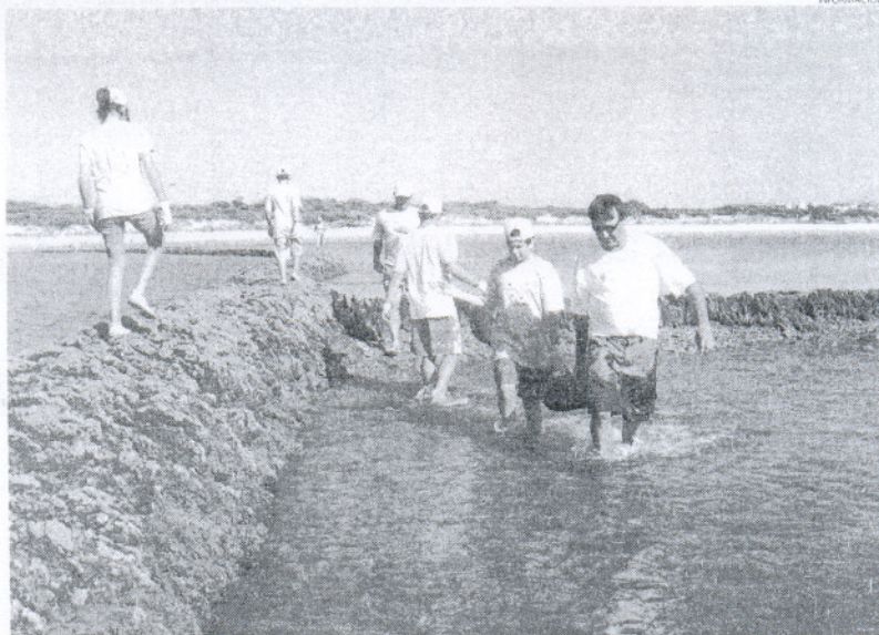
Los voluntarios aprendieron de primera mano cómo se mantienen los Corrales de la localidad.

Para finalizar los participantes pudieron conocer un poco más a fondo y de primera mano los métodos de pesca que se desarrollan tradicionalmente en los corrales, mediante las explicaciones y aclara-