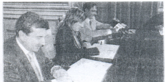
García firmó el acuerdo con el viceconsejero de Obras Públicas.

urbanización de la zona y la ordenación del borde urbano de la nueva avenida sobre el antiguo canal ferroviario.