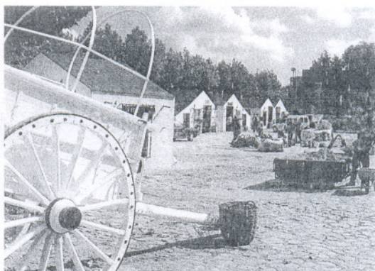
El pueblo retrocede dos siglos atrás para contar la historia del bandolero. RAMON AGUILAR

Cerca de la una y media de la tarde se reproducirá el asalto a un grupo de arrieros y una hora después el bautizo del hijo de El Tempranillo que culminará con un banquete, una comida popular al estilo de 1832 y un baile de celebración con música tradicional que se prolongará hasta las cuatro de la tarde.