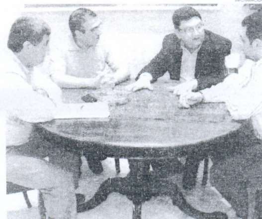
El alcalde escuchó las propuestas de los miembros de Hermandad.

tró una vez más su compromiso y el del Ayuntamiento con la restauración del patrimonio histórico cultural local, asegurando que el Consistorio se pondrá manos a la obra para buscar vías de financiación que hagan posible la rehabilitación de esta capilla, algo para lo cual se haría precisa la participación de diversas administraciones y entidades, como la Consejería de Cultura de la Junta de Andalucía, el Obispo, la propia Hermandad, el Ayuntamiento roteño, así como de diversas instituciones públicas y privadas de la localidad.