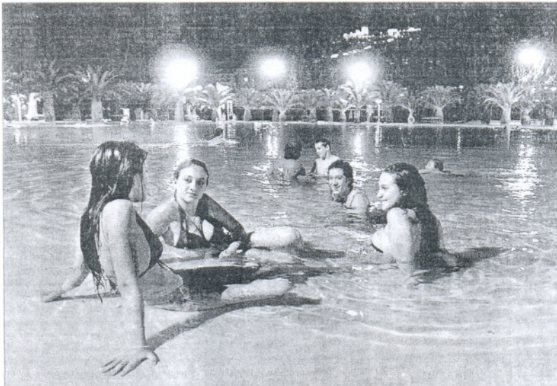
Jóvenes toman un baño nocturno en la piscina municipal de las Fuentezuelas, en Jaén.

El influjo del siete marca este año la bienal de Málaga en Flamenco. Siete son también los conciertos que conforman Su homenaje , el tributo al maestro guitarrista, que empezó ayer con la actuación de Tomatito.