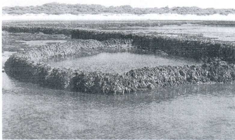
Los corraleros aún no tienen permiso para ejercer su actividad como lo hacen desde siglos atrás.

Según ha expuesto Antonio Alcedo, la preocupación radica en que nos encontramos con un monumento natural en el que la actividad de marisqueo no está regulada, cuando es esta su razón de ser. Así, ha insistido en que a la mayor brevedad posible quede desbloqueada en la Demarcación de Costas la cesión de los corrales al Ayuntamiento y en la Consejería de Pesca de la Junta de Andalucía se desbloquee también la cesión de los corrales al municipio roterño y se otorgue la preceptiva autorización para que éste pueda gestionar; tal y como determina el Plan de Uso y Gestión y el convenio firmado en su día, el monumento na-