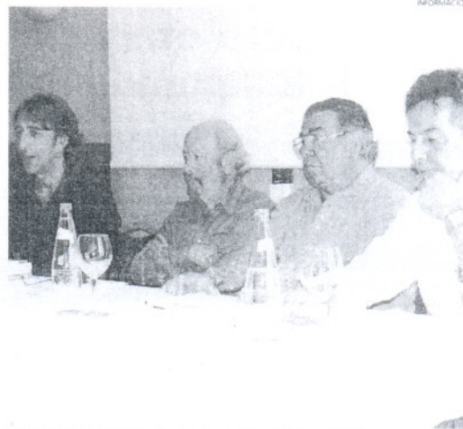
El jurado dio a conocer el premio en el Hotel Duque de Nájera.