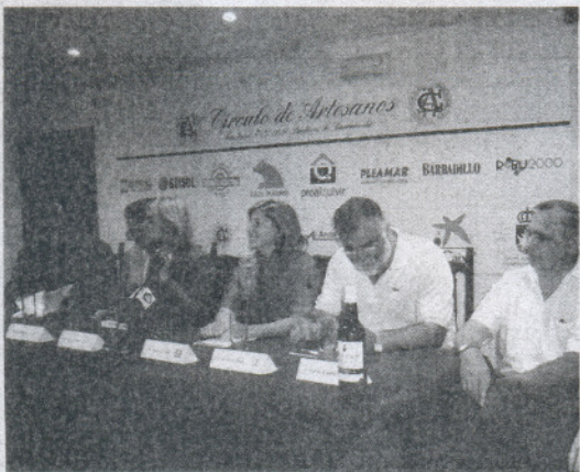
Los candidatos de los partidos que tendrán representación municipal.