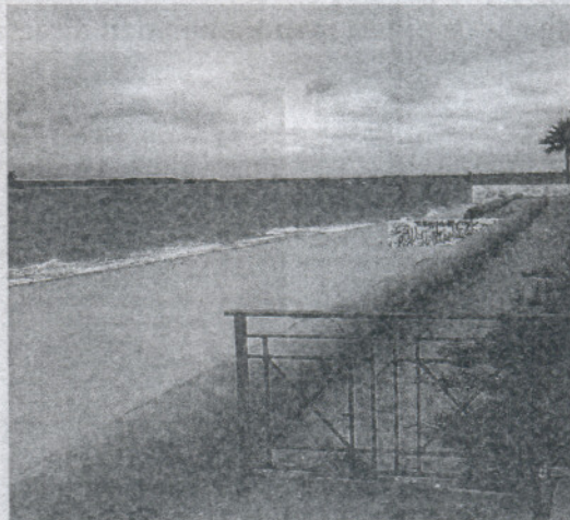
La playa de La Calzada vierte aguas fecales los días de lluvia.

Por otra parte, las playas de La Calzada y Las Piletas son consideradas puntos negros por verter aguas fecales a través del Arroyo de San Juan y los aliviaderos que desembocan en la playa en épocas de lluvias, «como evidencian las arenas negras y las algas bioindicadoras de contaminación». Una situación que Ecologistas en Acción ya denunció judicialmente en el año 1999. Asimismo, la oenegé otorga el punto negro a esta zona costera «por el despilfarro energético y la contaminación lumínica que suponen los 30 focos de 3.000 vatios cada uno».