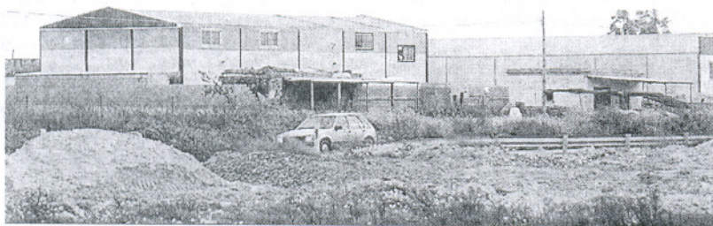
En la barriada El Almendral se construirán más de 180 viviendas.

También acuerdan como principales actuaciones la dotación de suelo industrial y la construcción de viviendas públicas