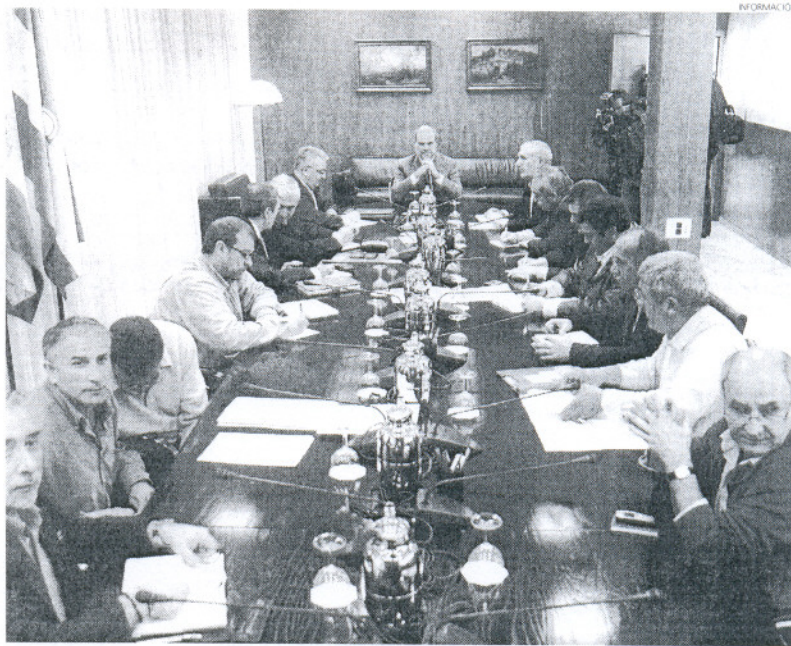
Una de las reuniones celebradas anteriormente entre responsables de la Junta y trabajadores.