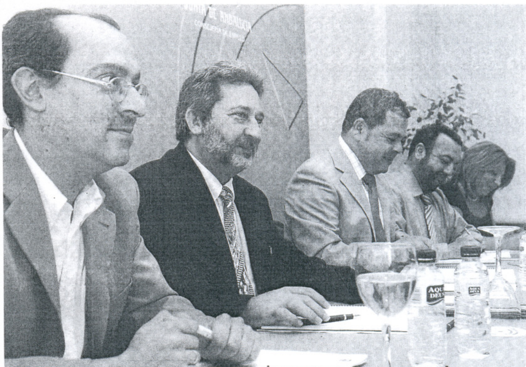
Representantes de las consejerías de Empleo y de Innovación, durante la reunión mantenida ayer en Sevilla con el comité de empresa de Delphi.

Sobre las firmas que ya hay seguras para suplir las carencias laborales que deja Delphi, el viceconsejero de Innovación señaló que, además de Génesis Solar, "ya hay tres o cuatro empresas más de este mismo sector". De hecho, añadió que el compromiso de la Junta de Andalucía es tener elaborado un calendario para que el 30 de septiembre esté definido el nuevo Plan Industrial para la Bahía. Es en ese marco en el que, se-