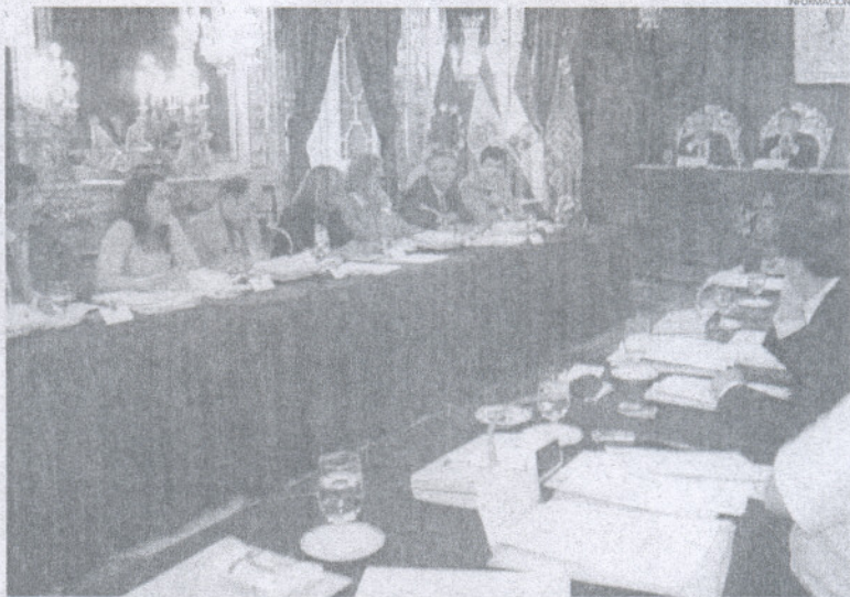
El PSOE se mostró satisfecho con el acuerdo llevado a cabo para gobernar la Diputación provincial.

En un comunicado, el grupo puertorealense de IU aseveró que, siendo la lista más votada el 27-M, tiene como principal objetivo for-