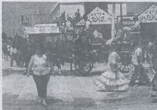
No se han adquirido la misma cantidad de bombos que en otros años.

«Esta cantidad extraordinaria de contenedores que el Ayuntamiento si adquirió en anteriores ediciones de la Feria no ha estado este año a disposición de los caseteros y demás trabajadores