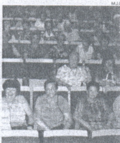
Asistieron cerca de 200 personas.