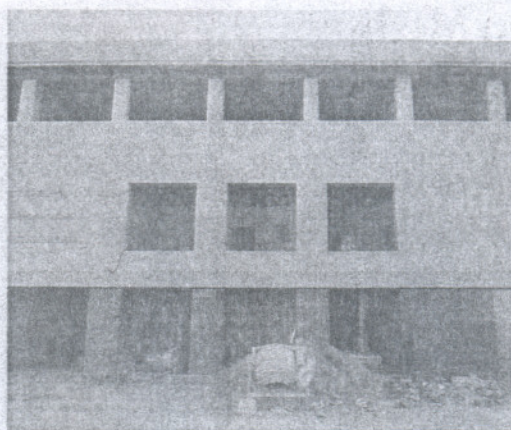
Una obra desierta en Chiclana, durante el día de ayer.