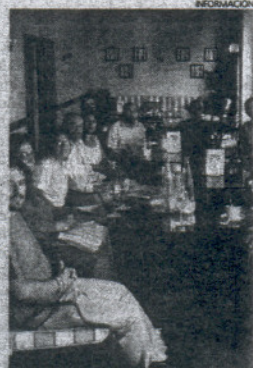
Miembros de la asociación.

Dentro del programa de actividades previsto para el día en el que se visite la capital gaditana, cabe destacar que la asociación contempla la salida a las 09.00 horas del domingo, desde el céntrico parque del Mayeto. Sobre las 09.10 tendrá lugar un desayuno en convivencia entre todos los participantes. El acto tendrá lugar en la zona comercial El Portalejo. En torno a las 10.30 los excursionistas subirán al autobús e iniciarán el viaje. Señalar que el medio de transporte será subvencionado por el Ayuntamiento de la