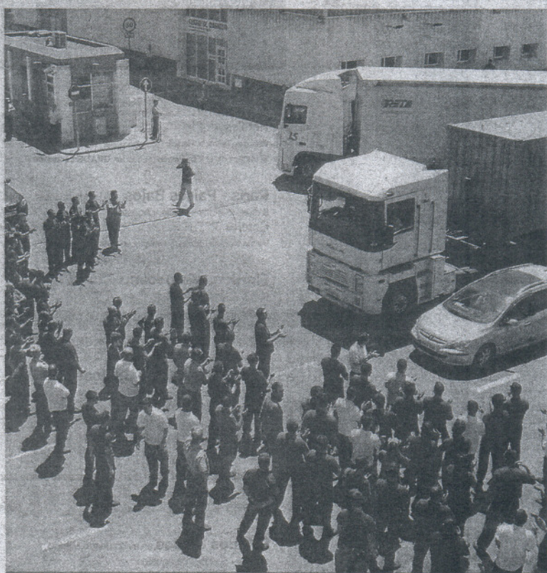
Trabajadores de la empresa auxiliar del sector aeronáutico, ayer durante el corte de carretera en la Zona Franca.