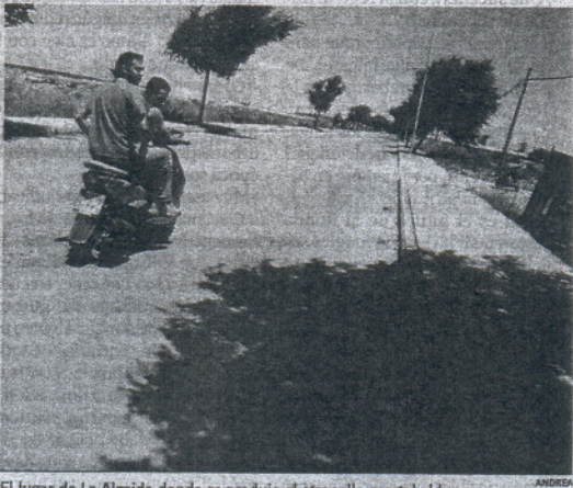
El lugar de La Algaida donde se produjo el atropello mortal el lunes.