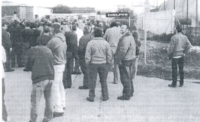
Un juez de EEUU ordena velar por el pago de las indemnizaciones a los trabajadores de Delphi.

Delphi anotará en los resultados correspondientes a los seis primeros meses del año unos costes de 268 millones de dólares (194,2 millones de euros al cambio actual) correspondientes al cierre de la planta de la localidad de Puerto Real.