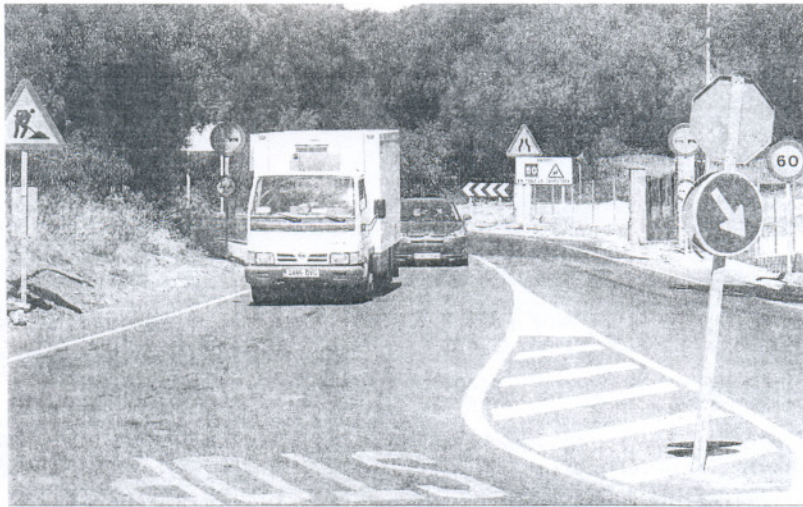
La carretera de la subida de San Miguel, en una imagen tomada el fin de semana.