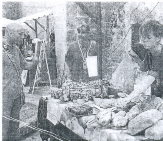
El Zoco Andalusi, celebrado este fin de semana en Vejer.