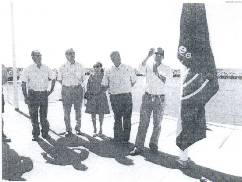
El puerto de Rota viene recibiendo la Bandera Azul desde hace al menos diez años.

La concesión de la Bandera Azul al puerto de Rota, que gestiona la Empresa Pública de Puertos de Andalucía (EPPA), garantiza la calidad de los servicios de este puerto, así como la realiza-