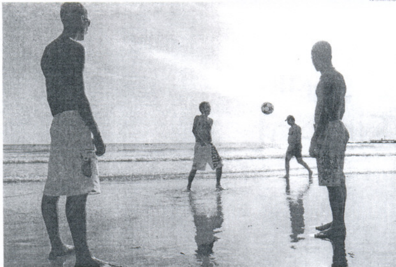
Un total de 232.809 turistas visitaron la provincia durante el pasado mes de julio.

En cuanto a viajeros han aumentado tanto los españoles como los extranjeros si bien destaca el dato de que este mes de julio ha aumentado la llegada de visitantes españoles en un 18,70 por