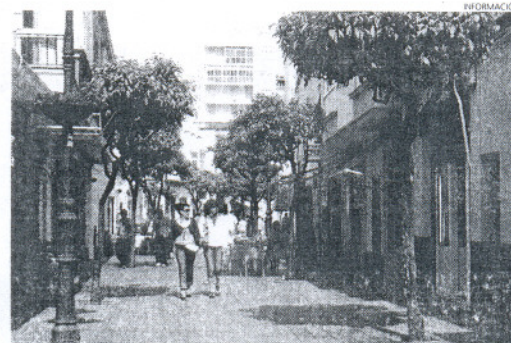
Izquierda Unida quiere un pueblo donde el peatón sea preferente.

Por otro lado, este partido también ha propuesto a los responsables municipales del tráfico aumentar el número de aparcamientos para bicicletas, o al menos instalar algunos soportes en puntos muy concurridos del casco antiguo y en edificios de servicios públicos, como en las plazas de las Canteras, San Roque, Bartolomé Pérez y plazaleta Padre