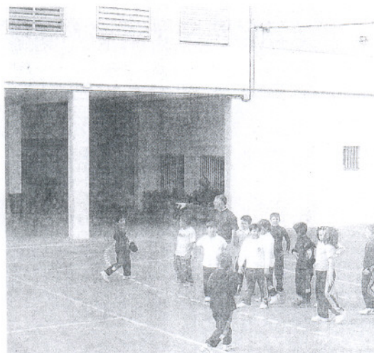
SAN JOSÉ DE CALASANZ. Uno de los colegios reformados.

En estos días se están inspeccionando las labores realizadas, al mismo tiempo que se están limpiando las instalaciones y volviendo a colocar el mobiliario. De esta forma, la concejal