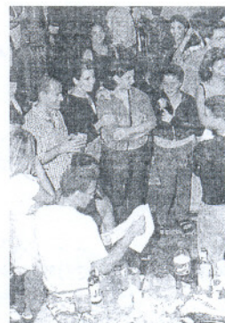
Los interesados pueden consultar la web del Ayuntamiento.

Por último, el edil específico que en la página del Patio Joven de la Junta de Andalucía se publicarán las empresas adheridas al Carnet Joven y sus descuentos correspondientes. Asimismo, la página web de Ayuntamiento colgará también estos contenidos en breve.