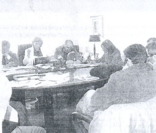
URGENTE. El Pleno celebrado en un despacho de Servicios Técnicos.

Además, han criticado que la operación se apruebe en una sesión urgente y organizada en el edificio de los Servicios Técnicos municipales, sin la solemnidad que le da el Salón de Plenos a las sesiones. Considerando que el mismo se ha celebrado de este modo con el fin de conseguir la menor repercusión mediática