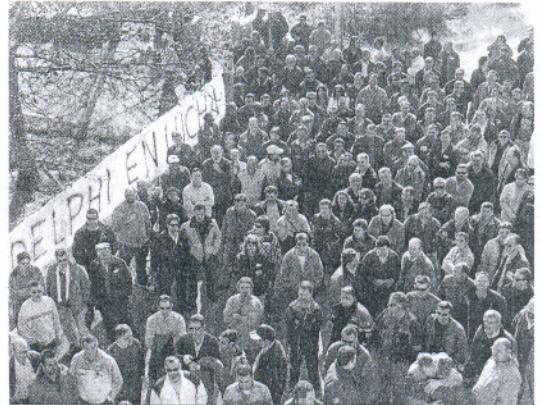
Los ex empleados de Delphi esperan la llegada de septiembre.

Igualmente, queda por saber qué empresas se asentarán en la zona tal y como aseguró la administración autonómica, con el objetivo de paliar la pérdida de puestos de trabajo. Para ello deberán iniciar el referido proceso formativo todos los ex empleados de Delphi que, por el momento, desconocen hacia qué tipo de trabajo deberán enfocar sus esfuerzos.