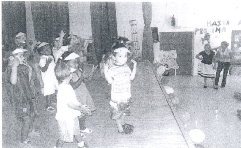
LÚDICO. Los pequeños en edades comprendidas entre 3 y 10 años disfrutaron con los talleres.