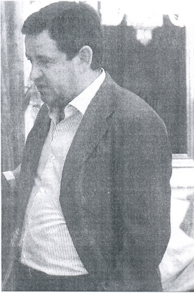
ta electoral como máximos responsables respectivos del PSOE y del PP.

El nuevo curso político debe servir para garantizar el futuro de la plantilla de Delphi y para avanzar en las infraestructuras en marcha