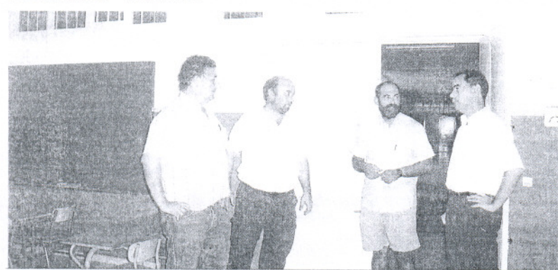
Visita del alcalde, José Luis Calvillo, al colegio de Torreveja.