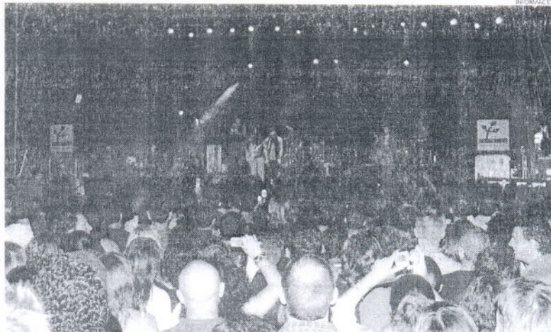
Gran afluencia de público en el polideportivo municipal del recinto ferial con el grupo 'El Bicho'.

Dentro de la programación, Montemayor Laynez ha destacado todas aquellas actividades que son habituales cada verano y que se han convertido en una costumbre para el público como son los Martes Clásicos y Literarios, los Miércoles Flamencos, con la colaboración de la Tertulia flamenca El Viejo Agujeta, las exposiciones en el Palacio Municipal Cas-