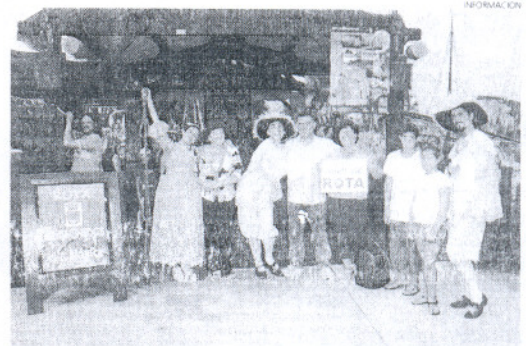
Más de 800 personas participaron en la visita al parque temático.

Por otro lado, la Fundación Municipal de Turismo también participó activamente en este día con la instalación de un stand de promoción turística en Isla Mágica a través del cual se dio a conocer al municipio entre las distintas personas procedente principalmente de toda Andalucía, Extrema-