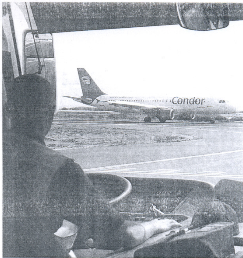
Un avión de Condor, visto desde un autobús jardinera, en el aeropuerto de Jerez.