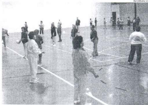
PSOE pide al alcalde que se retome la actividad a la mayor brevedad.

"Nada más lejos de la realidad, este Ayuntamiento y todos los demás deben preparar sus acuerdos basándose en los trámites que la Ley obliga, y el intentar, como siempre, culpar a otros de que algo no funciona, no es aceptable", criti-