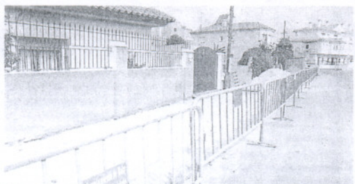
OBRAS. Este es el aspecto que presenta la calle. / P. A.

Se está instalando el acerado que faltaba en la calle Nueva Jarilla, ubicada entre las avenidas Diputación y Príncipes de España. Dichas obras se están ejecutando a través de la solicitud realizada por el Ayuntamiento de Rota para que las mismas se incluyesen dentro de Plan Provincial de la Diputación de Cádiz. Precisamente, en el caso roteño no sólo se van a realizar mejoras en esta calle sino también en la calle Peña Laguilla y Canaletas, ambas en Costa Ballena. / LA VOZ