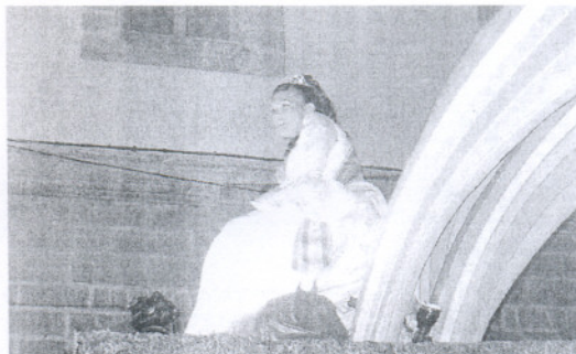
Las Damas se pasearon en sus carrozas para repartir ilusión.

A las ocho de la mañana, la Banda Municipal de Música Maestro Enrique Galán y la Asociación Musical Ruiz-Mateos así como la banda de la Hermandad de Nuestro Padre Jesús Nazareno prota-