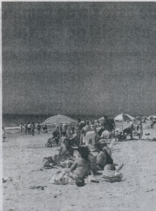
PERDIDA. La Costilla no tendrá bandera azul este año. / P. A.

Por su parte, Ecologistas en Acción otorgó ayer al litoral gaditano un total de 22 puntos negros y 15 banderas negras, lo que supone una más que el año pasado, que correspondió a la playa del Chinarra y Punta de San García en Algeciras, donde encalló el pasado mes de diciembre el buque fri-