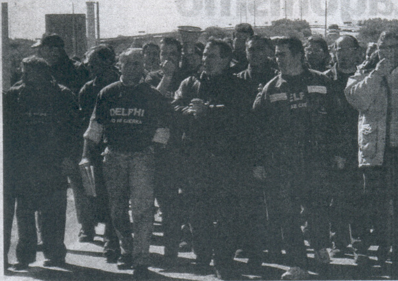
La Junta de Andalucía ha recurrido la admisión a trámite del Expediente de Regulación de Empleo de la plantilla.