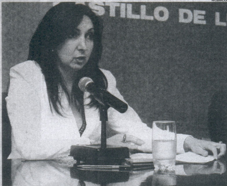
Antes de las elecciones la delegada de la Vivienda por aquel entonces anunció las ayudas.

Otra línea es en concepto de ayuda a la financiación de la entrada, con el fin de aplazar el pago del 30% de la misma hasta la fir-