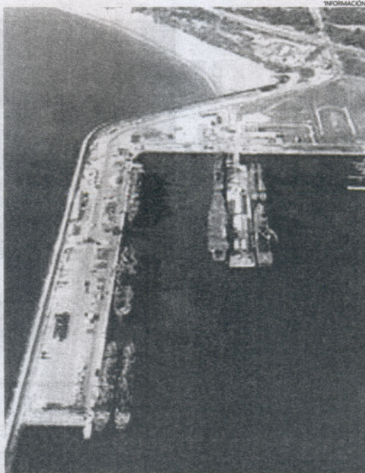
La Base descarta explosiones o errores en espacios de su competencia.

No obstante, se descarta que este último incidente guarde relación con el estruendo del pasado miércoles. Ese día tampoco se