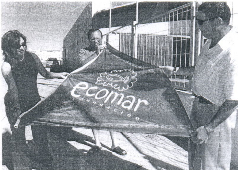
APUESTA. Los delegados municipales apoyaron esta iniciativa formativa.

se lleva a cabo con los pequeños que participan en los programas específicos puestos en marcha desde la Delegación de Deportes del Ayuntamiento de Rota y en los que participan alumnos de los diferentes colegios de la localidad. En la temporada estival también se desarrolla esta