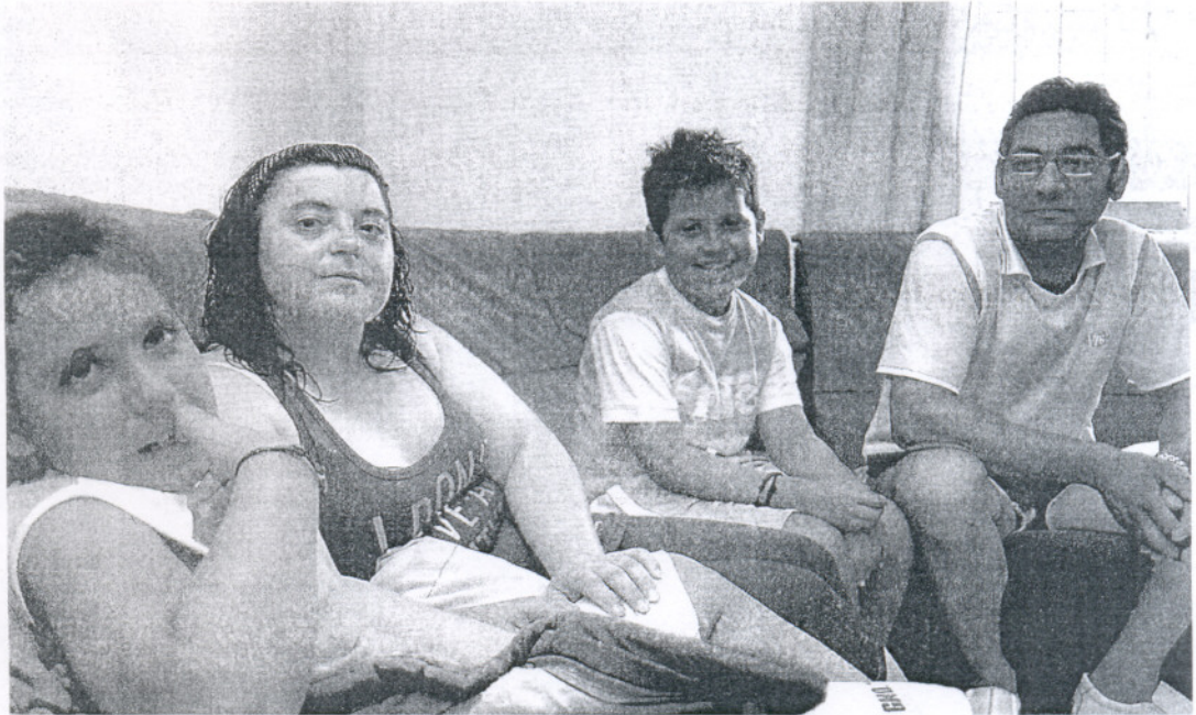
AL COMPLETO. Los niños, de 10 y 15 años, sonríen ante la cámara de fotos mientras su padre los observa con preocupación.

«Cada vez somos más familias que salen a la luz con este pro-