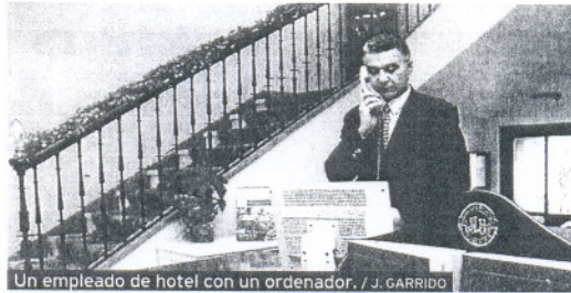
Un empleado de hotel con un ordenador.

lúa la implantación de dispositivos como ordenador personal, acceso a internet, correo electrónico o telefonía móvil, entre otras. La Junta destacó que este sondeo muestra que, de la oferta de alojamientos, es la del litoral y en especial la de categoría alta la que dispone de un mayor capital informático y hace un mayor uso de estas herramientas frente a la del interior de la comunidad que ha mejorado su posición respecto al año anterior.