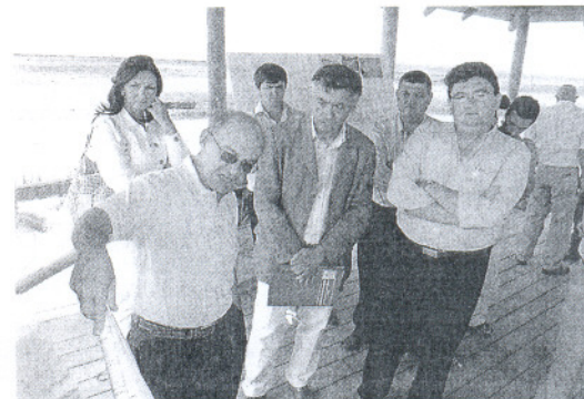
El alcalde y el representante de Costas visitaron el litoral roteño

Otro de los asuntos por desarrollar en la localidad, y al que se refirió el Jefe de Demarcación de Costas, se centra en la recuperación del dominio público marítimo terrestre, que en el caso de