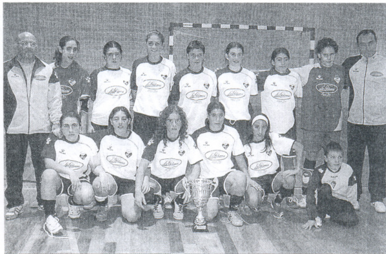
Equipo del Playas que ascendió después de ganar la Liga de la FAF, la Liga de la FAFS y el Andaluza de clubes.