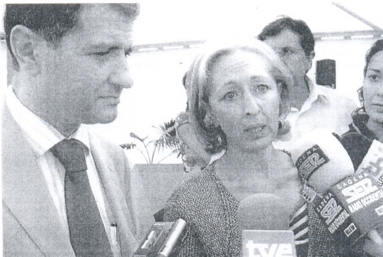
SANEAMIENTO. La consejera resaltó la necesidad del municipio de contar con esta infraestructura.

La instalación esstará insonorizada y controlará los malos olores