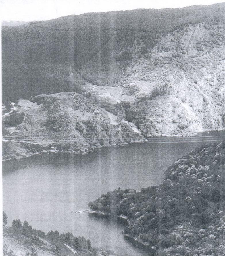
El estudio ha analizado la evolución de las cuencas de los ríos Guadalete y Barbate entre 2004 y 2007.

Otro elemento clave para lograr esta disminución han sido, según la Agencia Andaluza del Agua, los acuerdos alcanzados con las comunidades de regantes del Guadalete y Barbate "para opti-