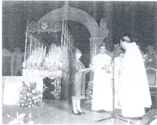
La Calzada vivió unos momentos muy emotivos en la Coronación.

Una vez concluido el recorrido, la imagen mariana llegó a La Calzada donde numerosos sanluqueños se concentraban espe-