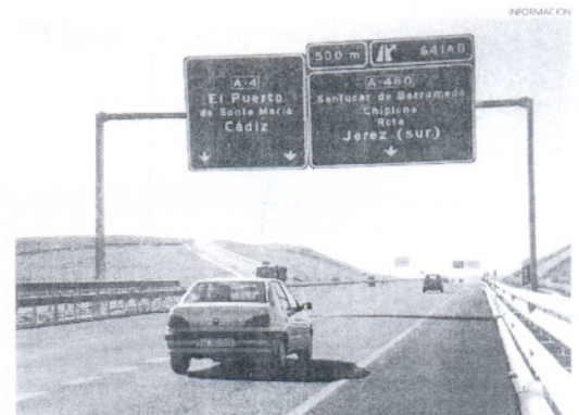
Rota ya aparece en las señalizaciones de la autovía A-4.

También desde partidos como PSOE o PA se cursaron peticiones a este respecto, así como desde la Federación de Empresarios de Hostelería de Cádiz, Horeca.