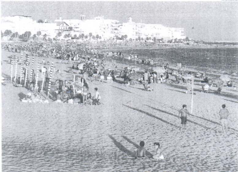
Las playas roteñas, objeto de un estudio de satisfacción de sus usuarios y visitantes.

En cuanto a los motivos para acudir a una u otra playa, parece ser que la cercanía es determinante, seguida por el gusto concreto de cada uno, la disponibilidad de aparcamientos o la disponibilidad de servicios, entre otras cosas. Los aspectos mejor valorados de las playas, según este estudio, son la limpieza de la arena, la limpieza del agua y los servicios de salvamento, mientras que los peor valorados son los servicios e instalaciones recreativas y los chi-