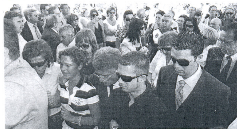
Cientos de vecinos, autoridades y dirigentes políticos apoyaron al alcalde de Benalup y a sus hijos.