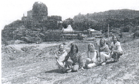
Los turistas describen el viaje como una vuelta a la edad media.

Según esta portuense, la experiencia fue excepcional y en ningún momento sintieron miedo durante el viaje. Ni siquiera contaron con escolta aunque rehusaron visitar zonas catalogadas como peligrosas como es el caso de los restos arqueológicos del