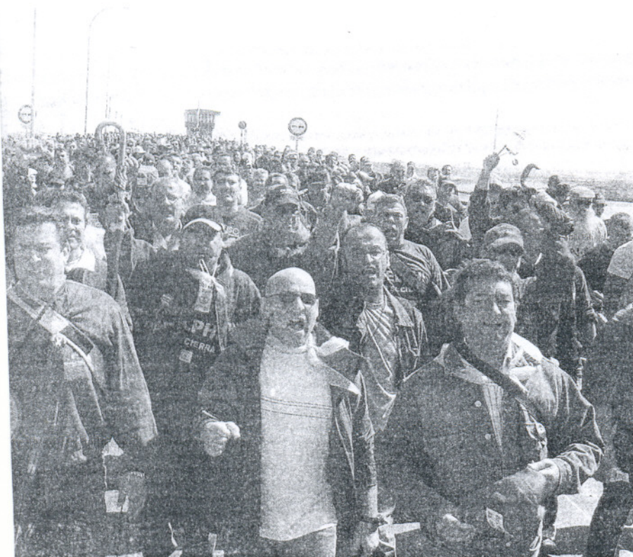
Los trabajadores de Delphi Puerto Real, durante una de sus manifestaciones hacia Cádiz.

Esta empresa ha mostrado su disposición por asentarse en la zona y tirar de la industria vinculada a Airbus, asentándose en Delphi