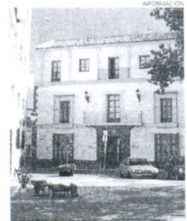
Oficina de Fomento.

La iniciativa está también abierta a grupos de personas que se consideran socialmente más vulnerables. En este apartado se incluirán las mujeres víctimas de violencia de género, personas con discapacidad reconocida en un grado igual o superior al treinta y tres por ciento, personas ex reclusas, usuarios del Programa de Solidaridad de los andaluces para la erradicación de la marginación y la desigualdad, drogodependientes rehabilitados, inmigrantes, minorías étnicas y jóvenes menores de treinta años que hayan tenido una medida protectora de acogimiento en un centro de menores. Las ayudas oscilarán entre los