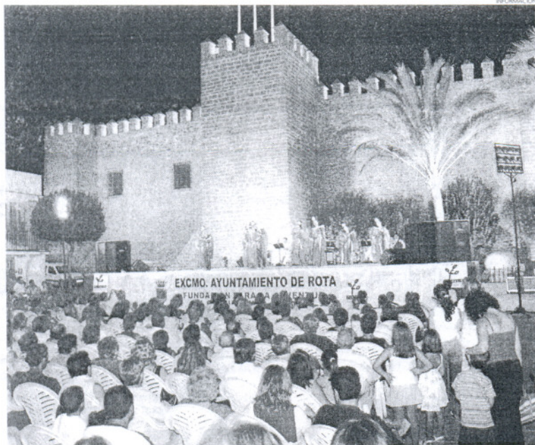
Imagen de archivo de la pasada edición del Verano cultural y juvenil.

OCIO Se inició con la exposición Artesanía Española Latinoamericana