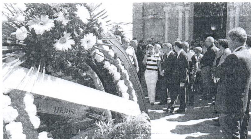
Momento en el que el féretro llega a la iglesia de Casas Viejas para el responso.