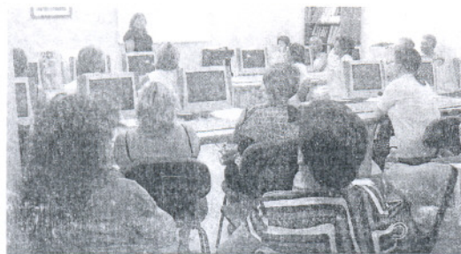
Mujeres de la asociación la academia informática Progreso en Conil.