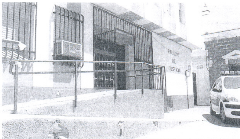
Entrada a los juzgados de San Fernando, una de las sedes judiciales en las que han sido realizadas obras de mejora. ELIAS