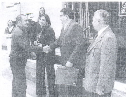
Un momento de la entrega de llaves de las viviendas.

Las 52 viviendas se encuentran construidas en la avenida de la Matea, en la zona de los nuevos suelos y se suma a las ya construidas y entregadas meses atrás en el sector R1. Un sector que no ha estado exento de dificultades para sacarlo adelante aunque en este acto esta-