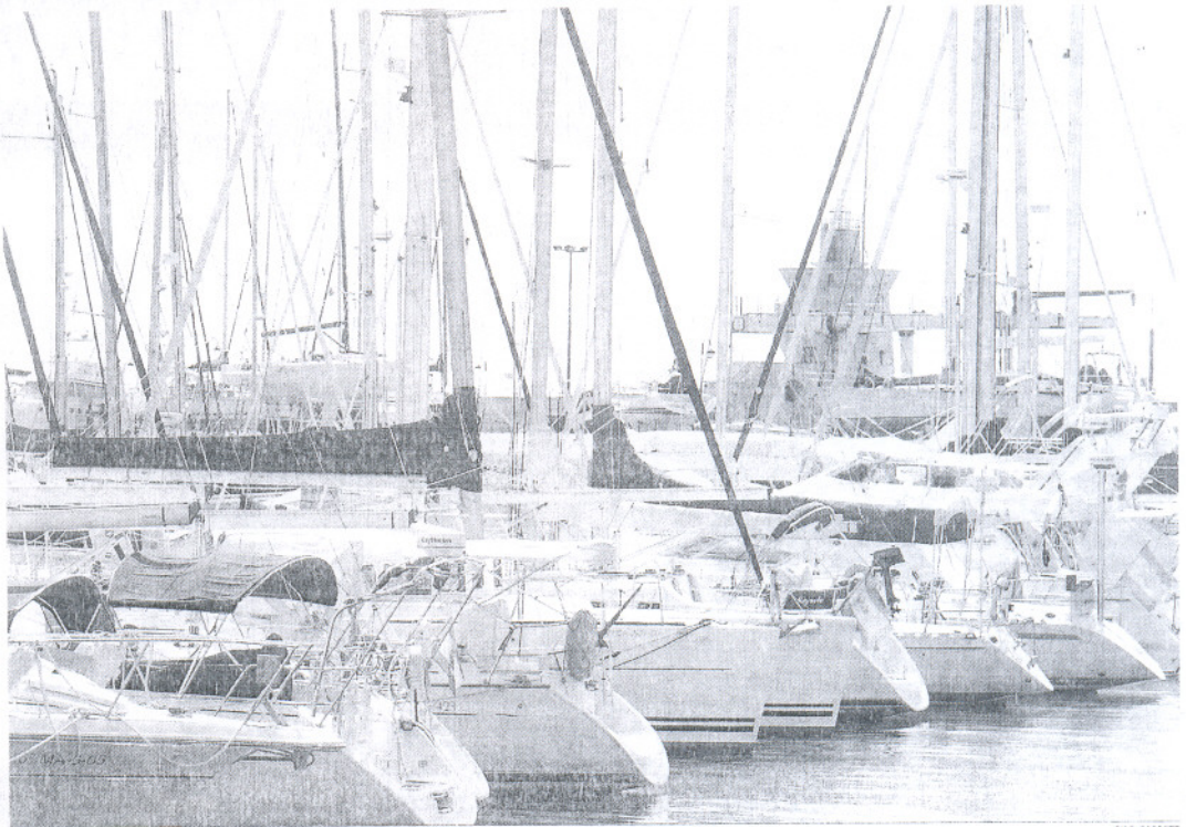
La dársena de Puerto Sherry podrá ver duplicada su capacidad con la ampliación propuesta por Marina del Puerto.

Este proyecto, en los términos que plantea Marina del Puerto, requiere de un exhaustivo estudio de Impacto Ambiental, y licencia de varias administraciones, entre ellas Demarcación de Costas. Ya en su momento, algunos expertos consultados por este diario manifesta-