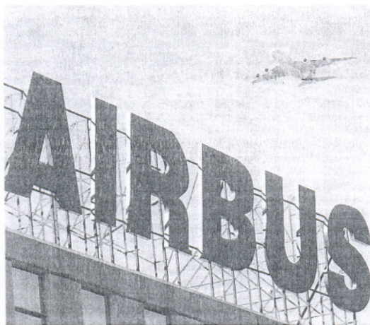
El A380, en su primer vuelo de pruebas sobre la factoría de Puerto Real.