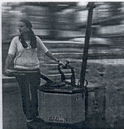
FUTURO. El desarrollo ha tenido reflejo en el mercado laboral.

Una evolución contrariamente opuesta a los tres puntos que son el modelo de crecimiento de demandantes de trabajo en Cádiz y, por lo tanto, de prosperidad económica y de desarrollo social: Conil, Medina Sidonia y Villamartín, donde el aumento de