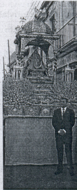
La Patrona de Sanlúcar.

Acompañando a la Patrona en su peregrinar por las calles más céntricas de la ciudad, la Agrupación Musical Virgen de la Caridad escoltaba a la imagen mientras entonaba marchas como Alfombra y Nardos , especialmente compuestas para esta popular imagen. Tras ella, la banda de música de Julián Cerdán completaba el acompañamiento musical con su elegancia y saber estar. Según la tradición, fue el