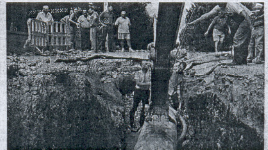
TRABAJO. Varios operarios intentan corregir el problema de