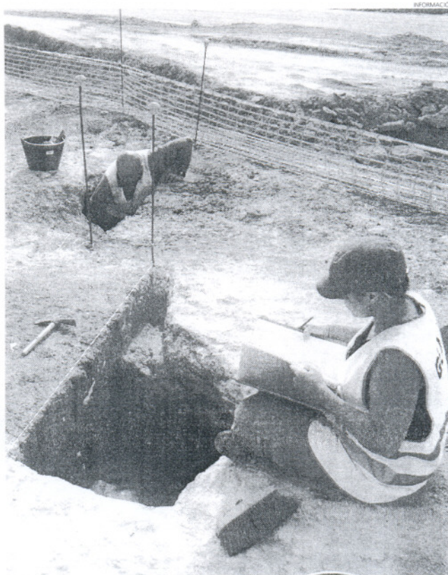
Los trabajos arqueológicos seguirán desarrollándose durante algunos días más.

—3— Autorización La excavación, realizada por la empresa Arqueosub Andalucía cuenta con la autorización de la Delegación Provincial de Cultura.