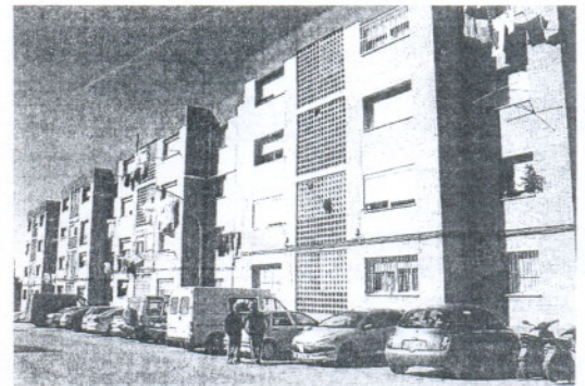
La tranquilidad del barrio dará paso a un fin de semana de fiesta.

Va por la tarde noche. Le llegará el turno al grupo flamenco Arie y Compás que subirá al escenario, donde un poco más tarde se llevará a cabo el acto de elección de la Miss Barriada, para