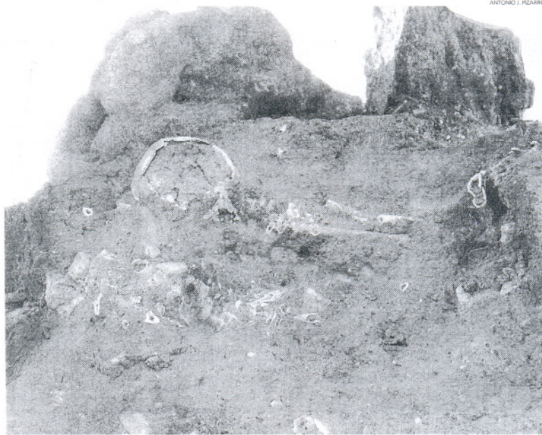
ANTONIO J. PIZARRO

Los arqueólogos responsables de la excavación de este yacimiento, puestos en contacto con este medio, han aclarado que era una conducta muy común en la antigüedad la reutilización de es-