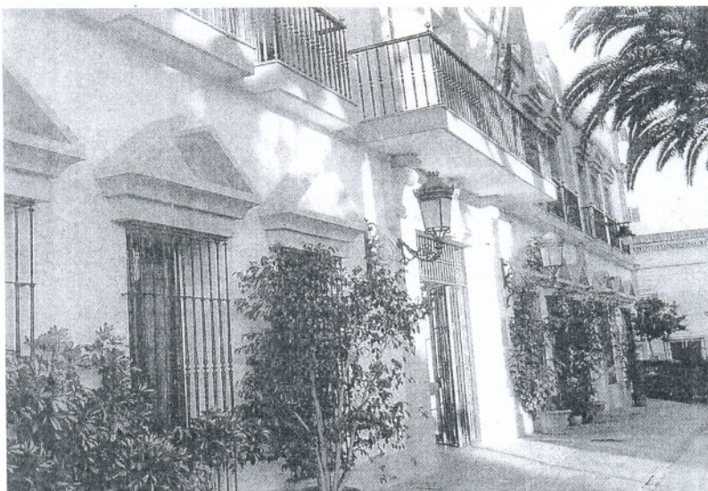
La sede de los sindicatos se ubicaría junto a las nuevas dependencias del Ayuntamiento.

«Ocho trabajadores adscritos a esta delegación fueron expedientados durante los meses de agosto y septiembre por mal comportamiento y despreocupación, sin que haya ningún documento que