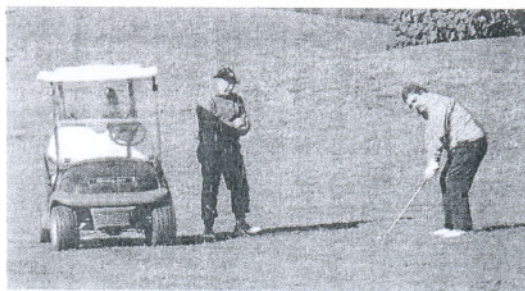
GOLF. Trebujena y Benalup tienen el mismo promotor.

Respecto al Pacto por la Vivienda, la FAMP reclamó medidas que permitan «agilizar todo el proceso de acceso a una vivienda de protección oficial».