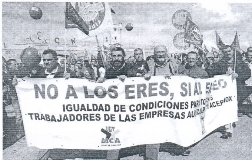
Un grupo de delegados sindicales de Acerinox, durante la manifestación del pasado martes en Cádiz.

"Lo que sería irresponsable es empeñarse en no adecuar la es-