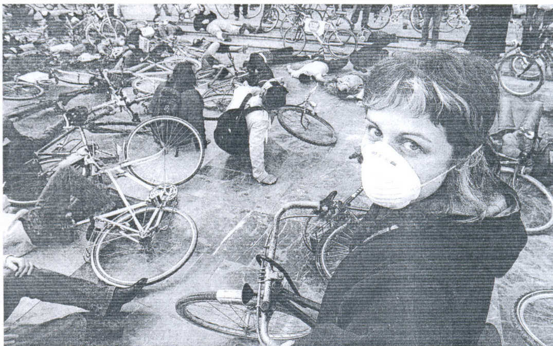
Una chica porta una mascarilla durante una protesta ciclista en Valencia.

La reunión nacional sobre salud pública ha recogido ejemplos de cómo poco a poco algunos ayuntamientos han conse-