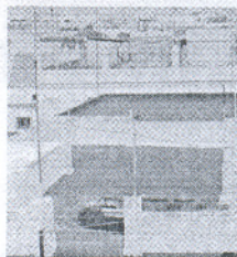
Techo derruido en La Viña.

Rescatan a una mujer tras caerse el techo de su casa en La Viña