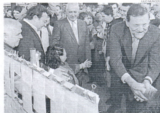
Rajoy y Arenas saludan a varios vendedores de cupones en Dos Hermanas.

plicar" los esfuerzos para que la llegada del PP al poder sea una realidad, Arenas dijo que hay que tener optimismo pero no caer en el triunfalismo, pero se comprometió a hacer todo el esfuerzo para que el cambio "cristalice" porque hay muchos andaluces que los están demandando.