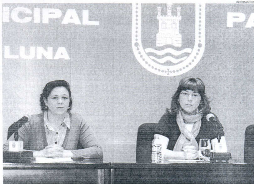
Los niños con TDAH sufren de hiperactividad y trastornos de la atención, lo cual les dificulta la vida normal.