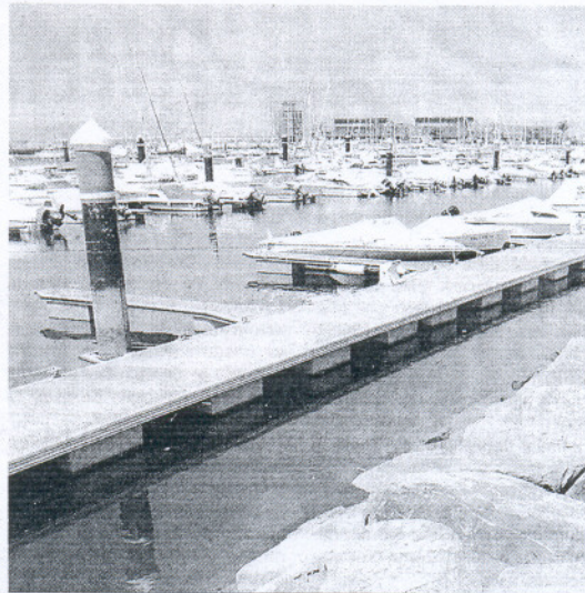
Pantalán flotante del puerto deportivo de Mazagón (Huelva). JUAN FRANCISCO MORENO

Con estos datos y a este ritmo, la directora general de la APPA, Montserrat Badía, no duda de que se logrará el reto marcado para 2015. Y a pesar de la crisis. "Las obras tardan