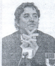
Luis García Montero.

Arranca la Feria del Libro con el pregón del poeta granadino Luis García Montero