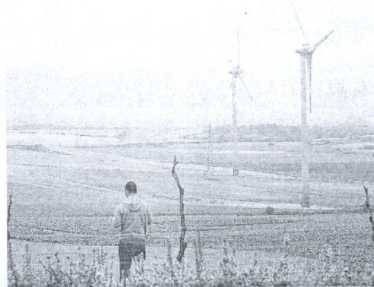
VERDE. Imagen del parque eólico de Puerto Real.

región, con 2.115,3 megavatios en funcionamiento, lidera el crecimiento eólico en España por segundo año consecutivo con crecimientos en el 2008 del 47% y del 112% en 2007. Cádiz copa el 52% de las instalaciones y no para de crecer. A este respecto, Soler consideró que la construcción de las nuevas instalaciones previstas generará una actividad que empleará a 3.000 personas en alrededor de siete meses.