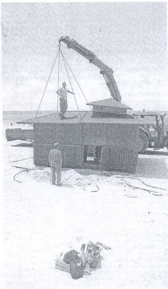
DESMTABLE. Instalación en la playa gaditana.