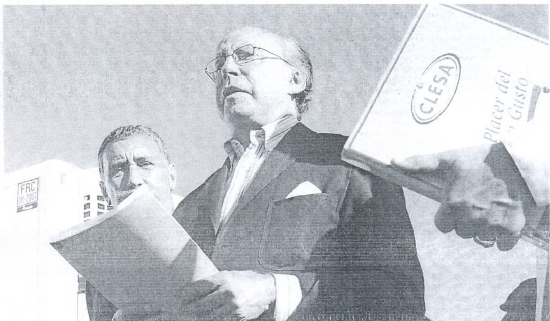
El empresario jerezano José María Ruiz-Mateos, en una comparecencia pública.

Paralelamente, se establecerá un contrato transitorio de prestación de servicios, de manera que Kraft realizará de forma temporal algunas funciones de apoyo para facilitar una transición ordenada del negocio. Kraft Foods anunció el cierre de la planta de Mahón el pa-