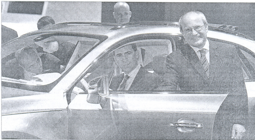
Miguel Sebastián y el príncipe Felipe, en el interior de un Audi Q3, junto a José Montilla, ayer en el Salón de Barcelona.