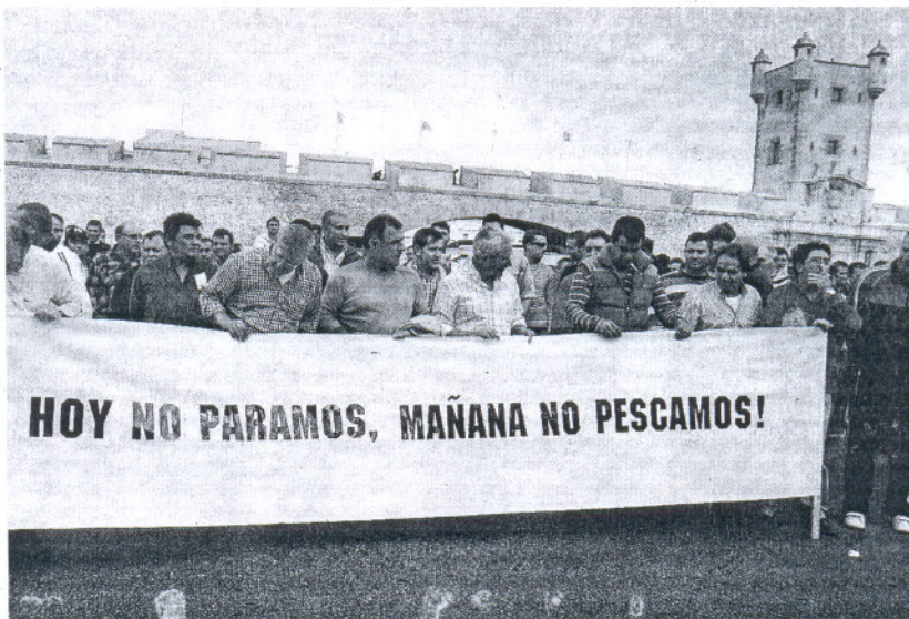
CONCENTRACIÓN. Unas 600 familias barbateñas dependen de la pesca de cerco.