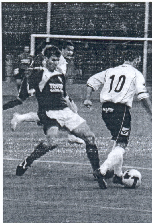
Los jugadores locales llevaron la iniciativa durante mucho tiempo. J. ROJO

Se vieron dos caras bien distintas del Olont, pese a ir por delante en el marcador. En el primer tiempo se vio un equipo más ofensivo y