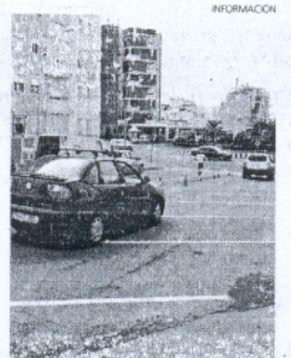
Ahora caben más vehículos.

de espacios hábiles posibles para estacionar. Operarios municipales son los que se han encargado en estos días de señalizar y pintar la nueva zona de estacionamiento.