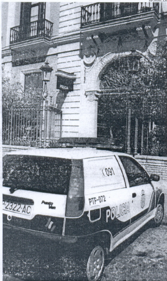
Las peticiones y exigencias de los sindicatos de la Policía Nacional son debatidos y expuestos durante las juntas provinciales que se celebran cada tres meses.