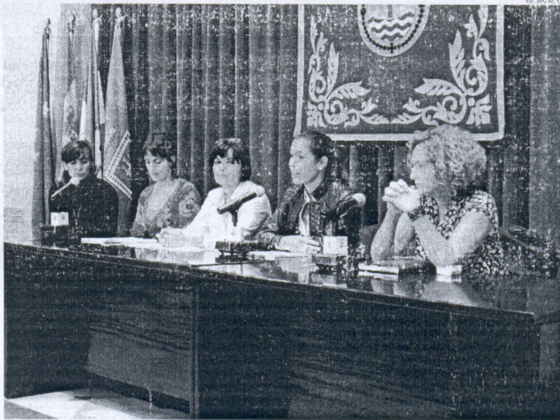
La delegada de Educación dio la bienvenida a las mujeres asistentes y a las ponentes de las jornadas.