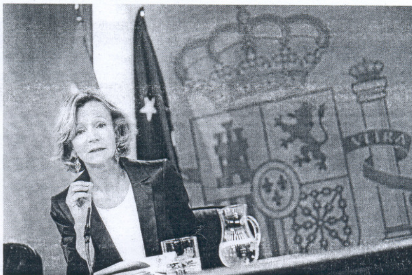
La vicepresidenta segunda y ministra de Economía, Elena Salgado.

Como principales medidas fiscales, el Ejecutivo subrayó la ampliación de la deducción por inversión de I+D+i del 8% al 12%,