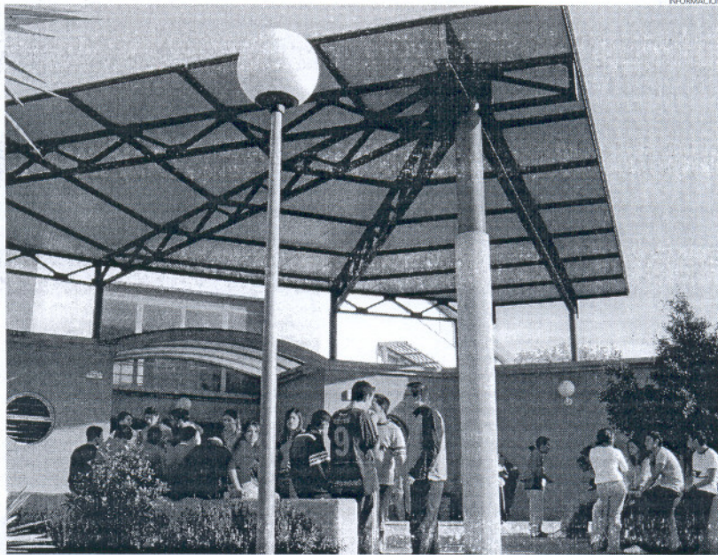
Los protocolos a seguir en casos de absentismo tendrán su coordinación con la Fiscalía de Menores de Cádiz.