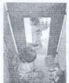
El plazo, hasta el 5 de junio.

El lunes se abre el plazo para solicitar plazas en las guarderías públicas y concertadas