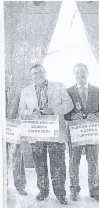
Templete Municipal.