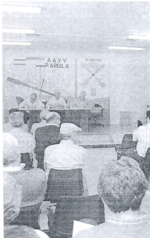
Reunión del consejo vecinal, ayer en un centro cívico isleño.