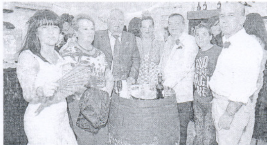
Responsable de Cayte-Gálvez y familia, ayer a media tarde disfrutando del ambiente de la caseta.