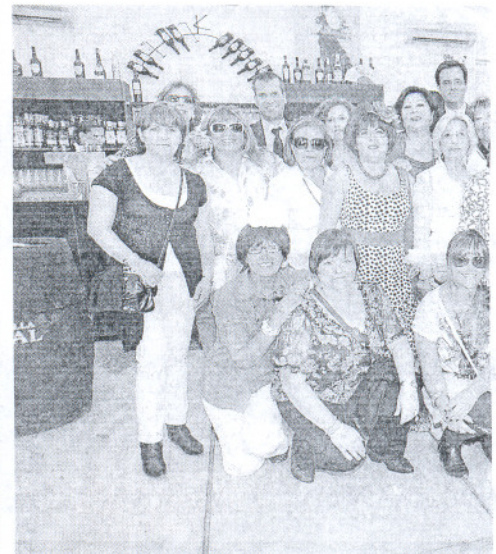
Monitora y alumnas de los talleres de gimnasia de Rota, jun