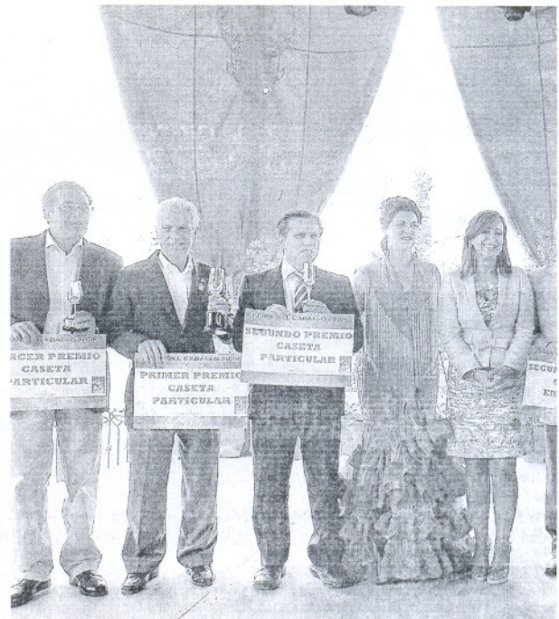
ACTO. En la jornada de ayer tuvo lugar la entrega de premios en el

Los terceros premios han recaído en El Corte Inglés y la Peña La Buena Gente, con unas casetas que imitan una vez más a casas rurales aunque con detalles bien distintos. La empresa ha apostado por la imitación de un inmueble gran-