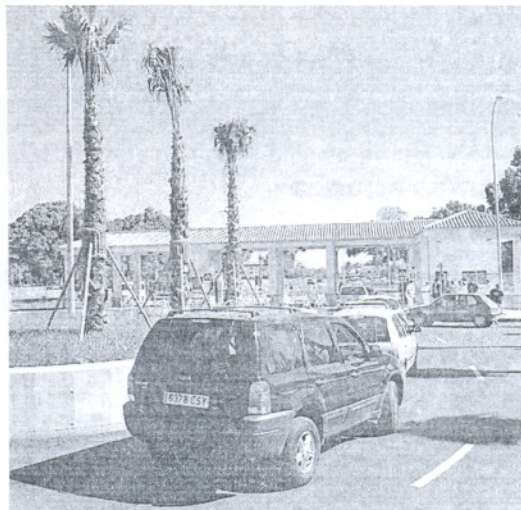
Uno de los accesos de la Base Naval de Rota.

Los empleados han denunciado el impago de los salarios aludidos y seguirán "luchando" para conseguir que San Xiao se los abone como corresponde. Así, los trabajadores han informado al alcalde que tienen previsto solicitar a la Marina Española que "detriga de las cantidades pendientes de pagar a la empresa por sus servicios prestados" el dinero que todavía están esperando percibir.