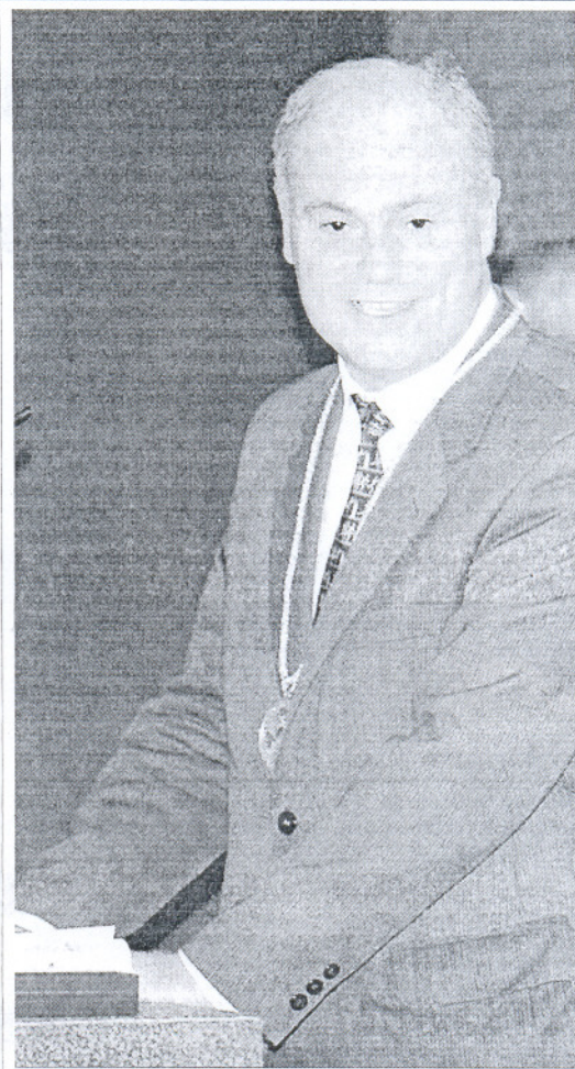
El nuevo secretario de Estado de Economía, José Manuel Campa.

Las cifras del primer trimestre revelan un fuerte deterioro de la actividad respecto al cierre de 2008. En el último trimestre del pasado año, la caída del PIB en tasa interanual fue del 0,7%, cuatro veces menos que entre enero y marzo, mientras que el descenso intertrimestral fue del 1%, ocho décimas menos. Con los últimos datos, la economía española encadena tres trimestres en rojo.