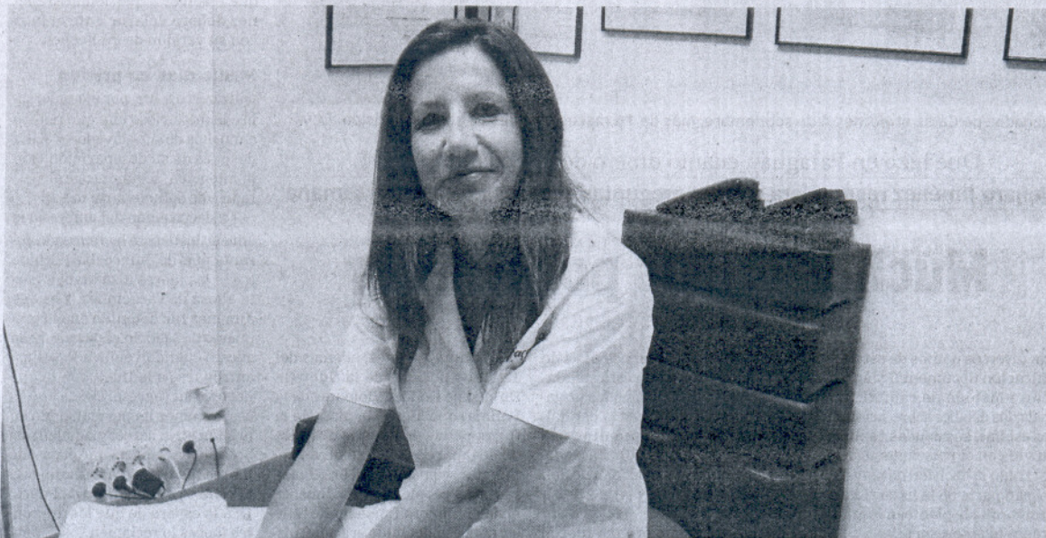
RELAX. Mercedes trabaja para hoteles y establecimientos de todo el entorno de la Bahía.

—Sí, eso es básico y esencial para la salud, porque volvemos con mucho estrés y continuarlas puede evitar posibles patologías o enfermedades, y deben hacerse como mínimo una vez en semana. Aunque como decía, los españoles se van adaptando poco a poco a estos tratamientos, y algunos prefieren ir al médico o la farmacología porque no saben los beneficios de la medicina alternativa.