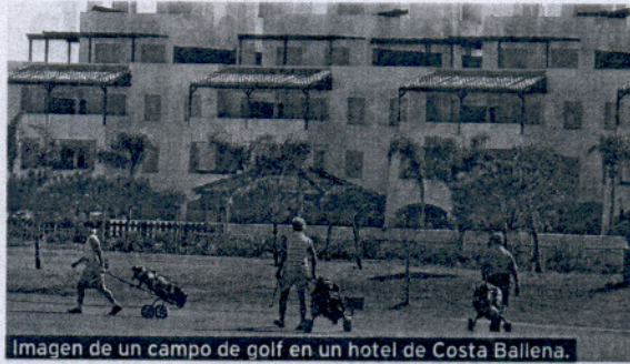
Imagen de un campo de golf en un hotel de Costa Ballena.

220.040 personas, lo que supone un 0,13% menos que el año precedente. Por zonas turísticas, la mayoría de los clientes corresponde a la Costa del Sol Occidental, con 80.644. La participación gaditana en esta particular oferta ha sido más bien anecdótica y se centró en el complejo de Costa Ballena (Rota), que ha participado en el programa con un hotel y donde se han contabilizado 4.073 usuarios, según los datos del operador.