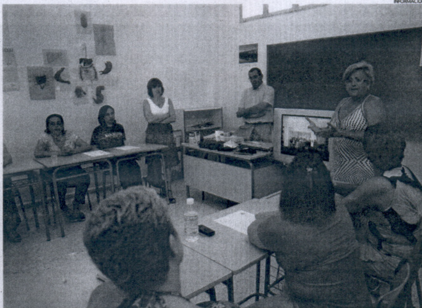
La delegada de Fomento explicó a las alumnas que Rota se adaptará a esta realidad social con nuevas residencias.

A lo largo de este semestre, las alumnas han recibido formación