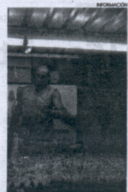
El stand de la protectora.

Los Ecologistas han explicado que el motivo de esta movilización es la de reivindicar que, al menos, durante la temporada estival se permita el acceso a la playa del Almirante al personal civil para su disfrute, buscando fórmulas que permitan mantener la seguridad del recinto militar sin sacrificar una playa pública de la Villa.