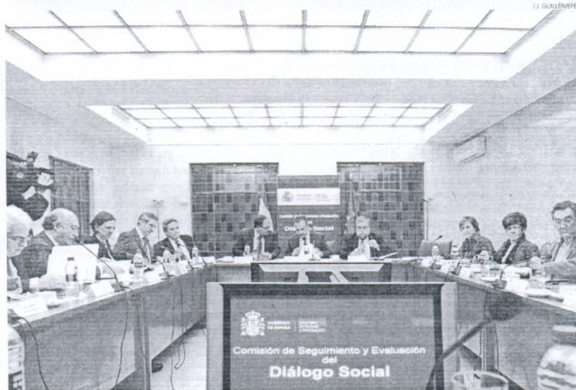
Un momento de la reunión de la Comisión de Seguimiento y Evolución del Diálogo Social que tuvo lugar ayer.

El ministro dijo que estas propuestas supondrán un coste para las arcas del Estado de unos 1.500 millones de euros, y precisó que el Gobierno estudiará en cada caso el instrumento jurídico que requiere cada una de ellas, probablemente el decreto ley para la mayoría.