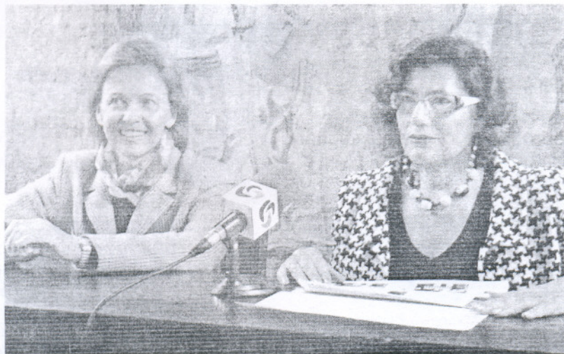
La presidenta de la Fundación Casa de Medina Sidonia y la concejala de Cultura, ayer presentando las jornadas.