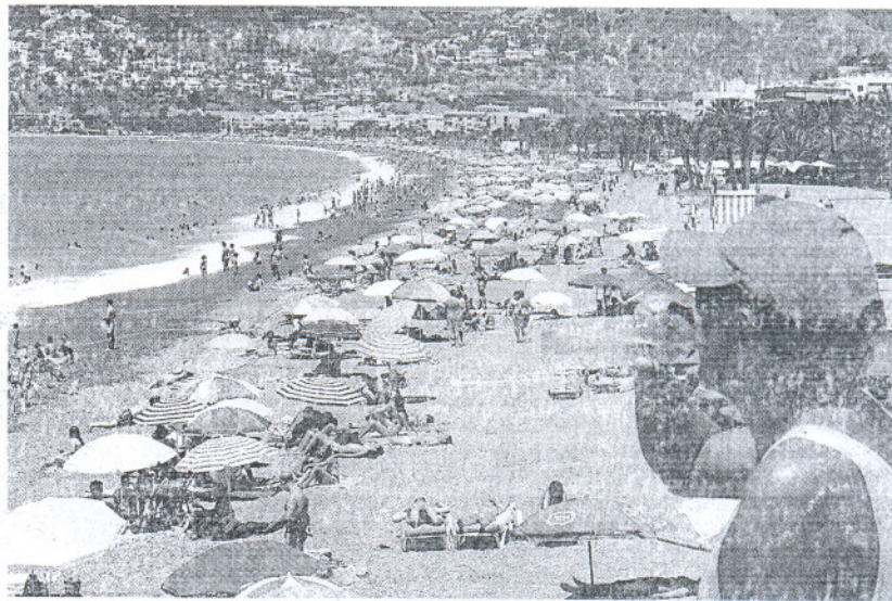
Si el clima acompaña, en esta Semana Santa no hay problemas para el baño en las playas

La Consejería de Turismo y los ayuntamientos del litoral malagueño firmaron ayer un protocolo para la limpieza de las playas durante los próximos tres años, lo que supondrá una inversión conjunta de 5,8 millones, de los que el 60% lo aporta la Junta y el resto los municipios. El acuerdo fue valorado de forma positiva por el consejero de Turismo, Luciano Alonso.