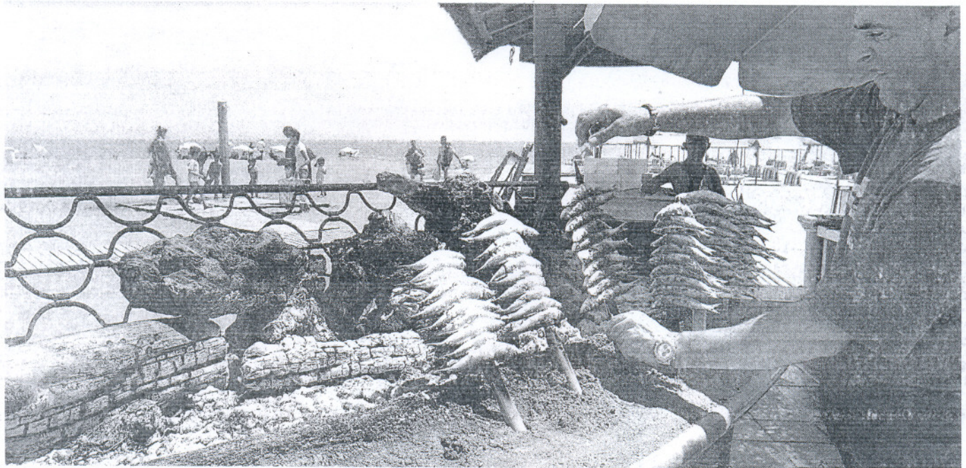
La Costa del Sol acoge unos 400 chiringuitos, aproximadamente el cincuenta por ciento de este tipo de establecimientos que hay en Andalucía