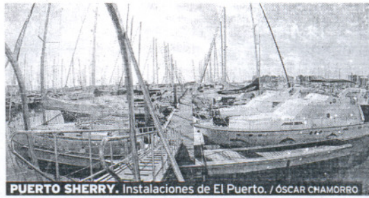
PUERTO SHERRY. Instalaciones de El Puerto.