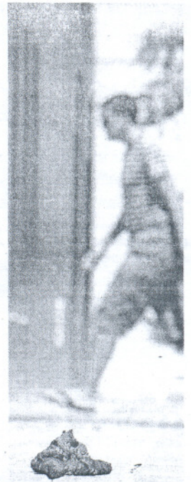
Heces en la vía pública.

En segundo lugar, desde UPyD manifestaron que «concienciar a los ciudadanos de que mantener su ciudad limpia no es suficiente. Esos habitantes que se dedican a dejar esas caquitas de sus mascotas no merecen el apelativo de ciudadanos. Son personas insolidarias que utilizan el espacio público como un territorio personal». A este respecto, el portavoz local apuntó que «es neces-