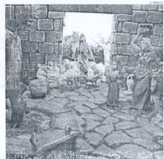
Los dioramas son muy elaborados, este es de Innova Foto Estudio.