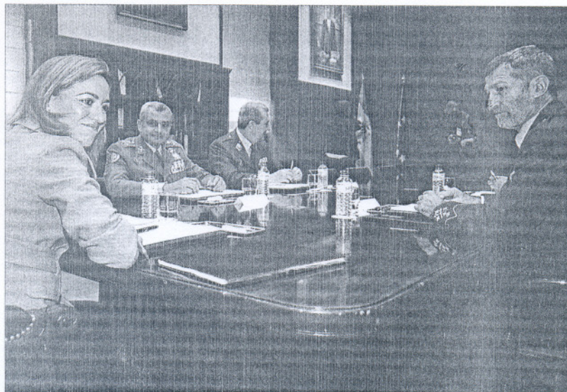
Chacón y la cúpula militar, durante la reunión que mantuvieron ayer.

En el comunicado, además de la plataforma de apoyo a Haidar, se cita al Centro Robert Kennedy de Justicia y Derechos Humanos, a las asociaciones de amistad con el pueblo saharaui, a las ONG de defensa de los derechos humanos, los parlamentos europeo, español y portugués, al pueblo de Lanzarote y "a todas las plumas libres en todo el mundo que lograron abrir una luz en el velo de oscuridad tejido por la grotesca propaganda de Marruecos. Ni una palabra para el Gobierno español.