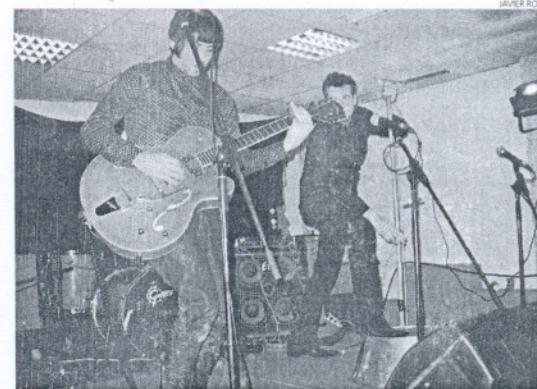
El grupo Guadalupe Plata sobre el escenario de la Sala Alternativa.

Desde las siete de la tarde que se abrían las puertas del local hasta entrada la madrugada estos grupos ofrecieron su repertorio al público que allí se congregó, y que como todos los años al finalizar se quedó con ganas de más. Así, el Inocente se va consolidando como una cita musical más de la escena provincial en Rota, como sucede en verano con el Mugre Rock.