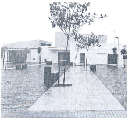
El nuevo edificio público de la barriada Virgen del Mar.

Se trata de una actuación urbanística ejecutada por las empresas Felipe Castellano y Construcciones Vistalegre con una inversión de más de 570.000 euros a cargo del Fondo Estatal de Inversión Local. La construcción comenzó en mayo pasado y ha durado siete meses, de acuerdo con el