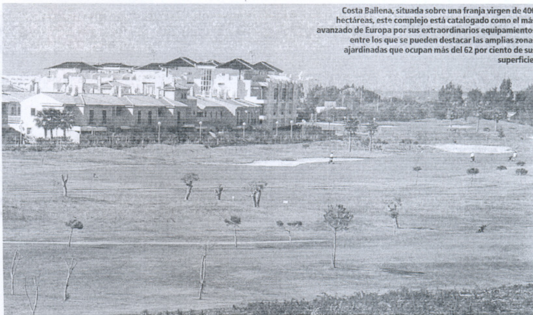
Costa Ballena, situada sobre una franja virgen de 400 hectáreas, este complejo está catalogado como el más avanzado de Europa por sus extraordinarios equipamientos entre los que se pueden destacar las amplias zonas ajardinadas que ocupan más del 62 por ciento de sus superficie.

Cádiz, entre las desembocaduras de los históricos ríos Guadalete y Guadalquivir, el pueblo de Rota ofrece un entorno de excepción que brinda al visitante una amplia y variada gama de atractivos de todo tipo. El principal atractivo para los turistas que la visitan son sus playas, más de dieciséis kilómetros de costa en los que se puede disfrutar de unas bellísimas playas de finas arenas y aguas cristalinas, desde la playa del Chorrillo (que contará en breve con un moderno paseo marítimo) hasta la de La Ballena, pasando por la playa de el Rompidillo, la Costilla, Piedras Gordas o Punta Candor... los visitantes ávidos de sol y mar pueden encontrar una gran diversidad de escenarios litorales de gran valor paisajístico recompensados todos los años, con las Banderas Azules de los Mares Limpios de Europa, al igual que su puerto pesquero-deportivo, denominado Astaroth, que también cuenta con la bandera azul, y que mejora cada año sus instalaciones.