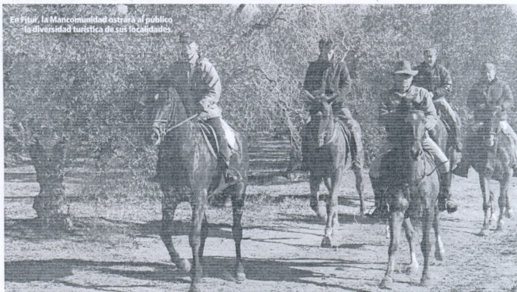
En Fitur, la Mancomunidad mostrará al público la diversidad turística de sus localidades.

La comarca del Bajo Guadalquivir -integrada por las localidades de Utrera, Los Palacios y Villafranca, El Coronil, Los Molares, Las Cabezas de San Juan, Lebrija y El Cuervo, en el sur de la provincia de Sevilla y Trebujena, Sanlúcar de Barrameda, Chipiona y Rota, en la costa gaditana del Bajo Guadalquivir- se asienta sobre un territorio marcado por el gran río de Andalucía, en el margen izquierdo de su tramo final y frente al Coto de Doñana.