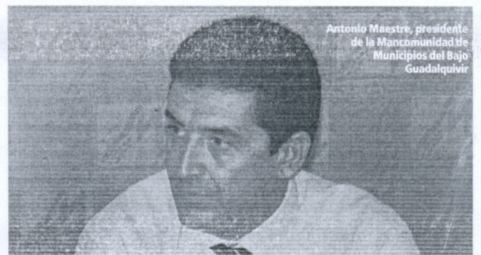
Antonio Maestre, presidente de la Mancomunidad de Municipios del Bajo Guadalquivir

Durante esta feria, la Mancomunidad muestra al público la diversidad turística de sus localidades para disfrutar durante todo el año, para lo que se difunden desde los grandes valores patrimoniales, culturales y naturales de los municipios de interior hasta la variedad de paisajes litorales, playas y actividades deportivas (golf, deportes náuticos) en los de la costa del Bajo Guadalquivir.