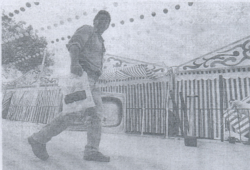
Un hombre lleva un fregadero a una de las casetas de la Feria en una fotografía tomada ayer.

Corrales destacó "la gran cantidad de actividades que se celebrarán en las distintas casetas municipales, desde el pabellón a la ca-