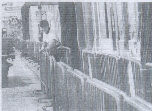
Operarios ultimaban ayer los preparativos para la motorada.

A la vez, el dispositivo está orientado a reducir la velocidad de los vehículos, en especial de las motos, tratar de reducir la contaminación acústica y canalizar la llegada de los motoristas hacia las bolsas de aparcamiento del Monasterio de la Victoria, Pozos Dulces, Plaza de Toros, Bajamar, y el parking del puente de San Alejandro, situado en la margen izquierda del río Guadalquivir y con una gran capacidad. Se dejan para la circulación de los vehículos las grandes avenidas que circundan el casco urbano y las calles Valdés y Larga, como recorrido natural de entrada y salida, aunque se han instalado resaltes y badenes