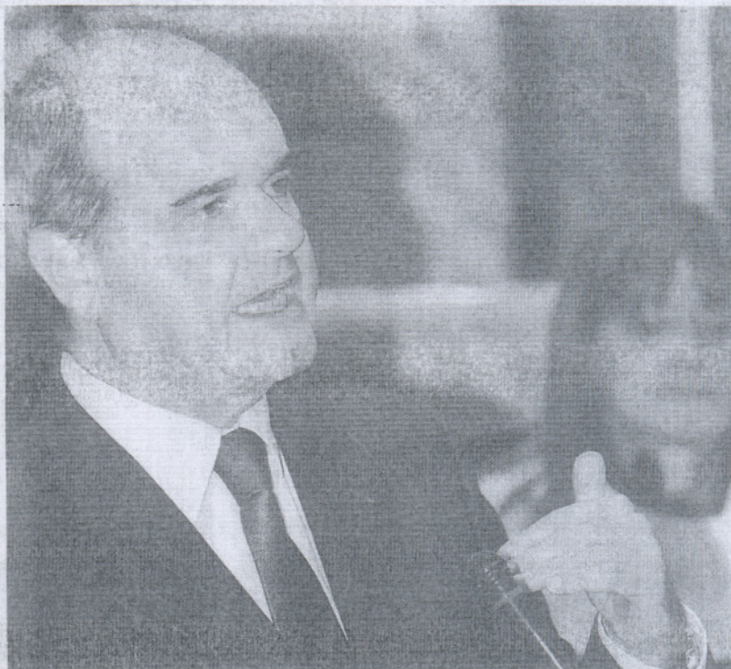
Manuel Chaves, vicepresidente tercero del Gobierno, ayer en la sesión de control en el Senado.

El pasado día 21, olvidando pasados desencuentros públicos en relación a este mismo asunto, el ex presidente andaluz se reunió con José Montilla, jefe del Ejecutivo catalán, y en este escenario admitió los agravios sufridos por la comunidad catalana. El cambio de discurso lo llevó a asegurar que "está claro que [el sistema] tiene que mejorar sustancialmente" porque "no es lógico" que su financiación per cápita esté por debajo de la media española. En Barcelona también anunció que el Estado aportará 8.000 millones de euros, la misma cantidad que reclamaba como presidente de la Junta de Andalucía y también fijó