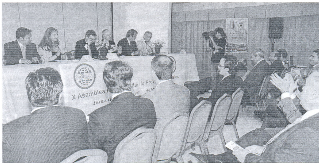
Ponentes en la asamblea anual de la asociación de hoteleros celebrada ayer en el Hotel Jerez.

En este nuevo intento liderado por Thomas Cook se incluyen dos novedades: el riesgo compartido entre los dos principales vendedores de viajes, y la estrategia clara de reducir los precios cuanto sea posible, sin remilgos, para atraer clientes a un destino que sigue siendo de verano.