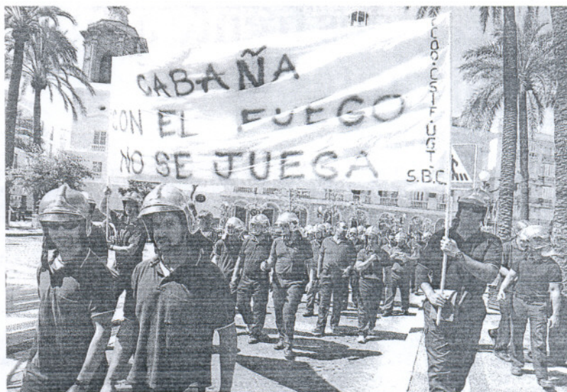
Los bomberos se dirigen ayer a Diputación después de concentrarse ante el Ayuntamiento de Cádiz.