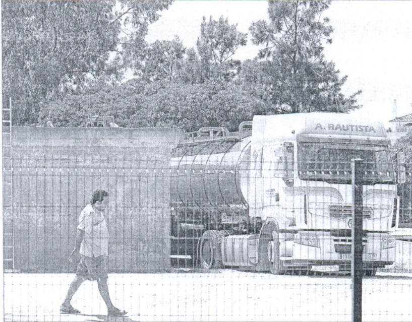
Un vecino de Costa Ballena pasea junto a un camión cisterna que está llevando a agua a la urbanización.