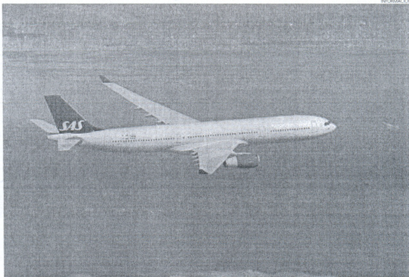
Imagen de un Airbus A330, similar al que incorporará a su flota la compañía Afriqiyah.

"Estamos a la espera de poder introducir el A330 en nuestra red